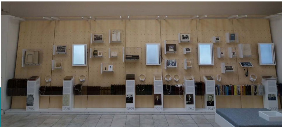
Az Apákról az utódokra szálló elhivatottság – A Munk-Munkácsi család története című tárlat részlet

A Munk-Munkácsi család története és a róluk szóló kiállítás nem csupán egy családtörténet bemutatása, hanem egyben a Magyar Zsidó Múzeum és Levéltár küldetésének és identitásának megtestesülése is. A kiállítás és az azt kísérő dokumentáció példa értékűen mutatja be, hogyan lehet egy család több évszázados történetén keresztül megvilágítani a zsidó közösség sokszínű és gazdag kulturális örökségét. A Munk-Munkácsi család útja rámutat arra, hogy a személyes emlékek és relikviák megőrzése, a hagyományok tisztelete és továbbadása hogyan formálhatják a közösségi identitást és emlékezetet. A kiállítás nem csak az egyéni sorsokat és családi történeteket hozza közelebb a látogatókhoz, hanem a zsidó múzeumi gyűjtemények jelentőségére és azok megőrzésének fontosságára is felhívja a figyelmet. Ahogy a múlt és a jelen összekapcsolódik, úgy válik egyértelművé, hogy a múzeumok szerepe nem csak a tárgyak bemutatása, hanem azoknak a történeteknek az életben tartása is, amelyek az általuk őrzött tárgyakban rejlenek.