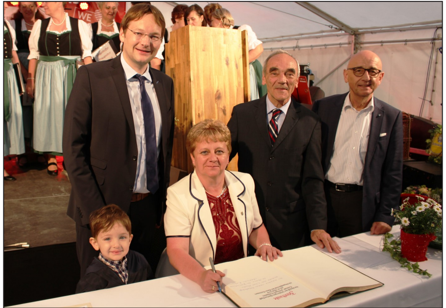
A 25 éves partnerkapcsolat megerősítése Jettingen-Scheppachban

Este tartották meg az évforduló fő rendezvényét a pünkösdi ünnepségen, ahol elhangzottak az ünnepi beszédek. Polgármester Asszony beszédében méltatta az elődök munkáját és köszöntötte azokat a német és magyar képviselőket, akik hozzájárultak a kapcsolatok erősítéséhez. Megemlékezett az együttműködés állomásairól, az iskolák és a zenekar közötti kapcsolatról és az emberek személyes találkozásáról. Az ünnepségen fellépett a Wagenhoffer kórus is, mely színvonalas produkcióval járult hozzá a