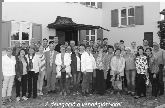
A delegáció a vendéglátókkal