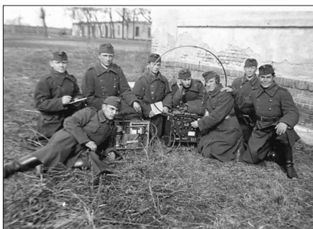
A Frigyes laktanyában

„1940 december 2-án vonultam be Komáromba az u.n. Frigyes laktanyába a tüzerekhez. Ekkor már több mint egy éve dúlt a háború Európában. Gondolom, ez is közrejátszhatott, a kiképzésünkben. Először gyalogsági kiképzésen vettünk részt, amely nagyjából 3 hétig tartott. Karácsonyra már hat nap szabadságot kaptunk. Szabadságom után, a lovas kiképzés vette kezdetét. Reggelente két turnusban a lovaglást, lóápolást, a fel-, és leszerszámozást gyakoroltuk. A lovas kiképzést követően különböző helyekre osztottak be minket: lövegkezelőnek, fogathajtónak, a parancsnoki szakaszba, vagy az első tiszti járőrbe. Az első tiszti járőrben pl. 2 rádió volt: az egyes és a hármas. Én a 3-as rádió parancsnoka lettem.