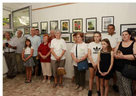
A kiállítás megnyitó pillanatai

Köszönjük, hogy megmutatták, mit jelent számukra a falujuk. Reméljük, kedvet kaptak a további alkotáshoz és jövőre is találkozhatunk műveikkel.