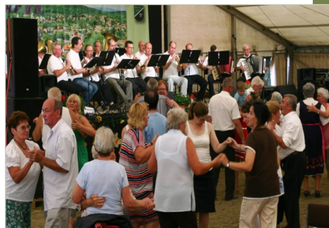
Táncra kelt a közönség a jó zenére

A német nemzetiségi önkormányzat meghívására énekes és táncos hagyományörző csoportok érkeztek hozzánk vasárnap délután. Pilisvörösvárról a Margaréta és a Rozmaring Táncscsoport, és a Nostalgia Dalkör. Új vendégként üdvözölhattük a Magyarpolányi Kórust, Nyugdíjas Kórust, és a Nemzetiségi Vegyes Kórust. Eljöttek a szendehelyi asszonyok. A házigazdákat a nyugdíjas kórus, valamint a német nemzetiségi táncscsoport képviselte. A jó hangulatot az Alte Kameraden zenekar játéka fokozta, melyre megtelt a színpad előtti táncter.