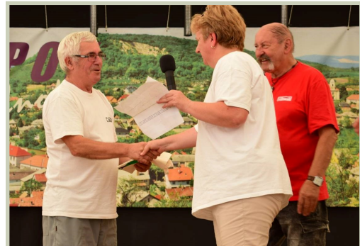
A baráti főzőverseny győztesei a horgászok

ráztatva el a nagydímet csillogó tehetségükkel.