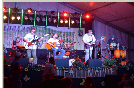
A sztárvendég Odeion zenekar LGT estje