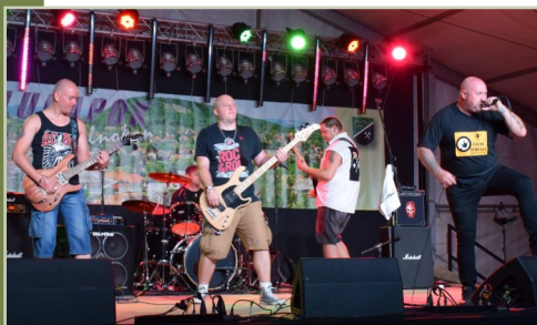
Az Üzemi Terület a színpadon