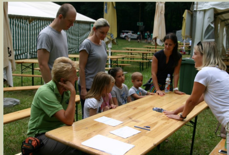
Az Elhivatott hivatalnokok akcióban

A délelőttöt az Ametist Bábszínház vidám meséje, a Makktündér csodái zárta a gyerekek legnagyobb örömeire. Jövőre visszavágó!