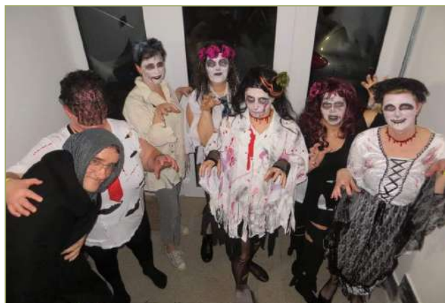
A meglepetés műsor vállalkozókedvű szereplői