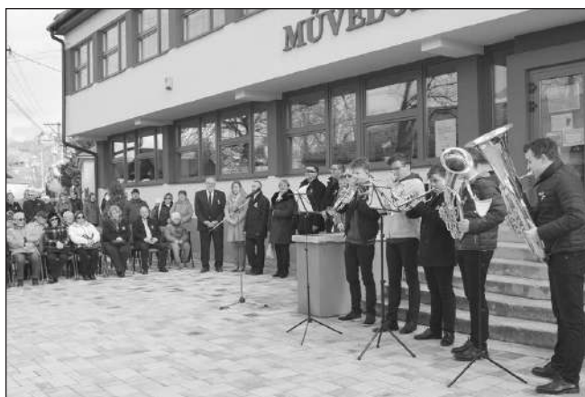
A zeneiskola diákjai indulókat játszottak.