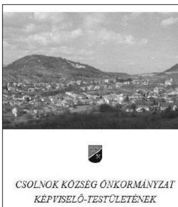
CSOLNOK KÖZSÉG ÖNKORMÁNYZAT KÉPVISELŐ-TESTÜLETÉNEK

A településképi véleményezési eljárást az építési engedélyhez kötött építési tevékenységek esetében kell lefolytatni.