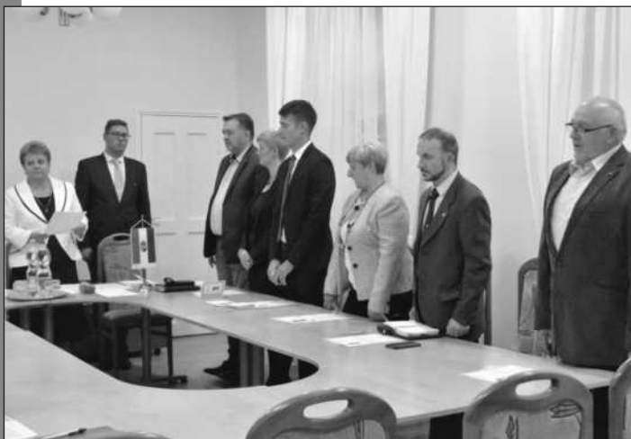
A képviselők leteszik esküjüket