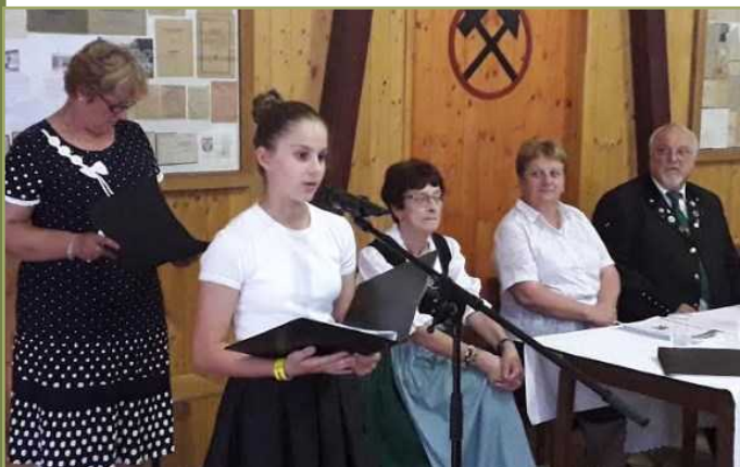
Németi Dóra szavai