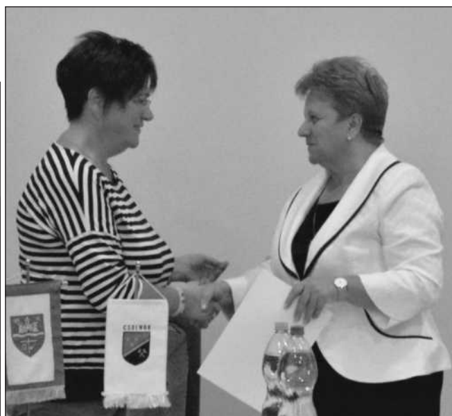
Polgármester asszony átveszi a megbízólevelét