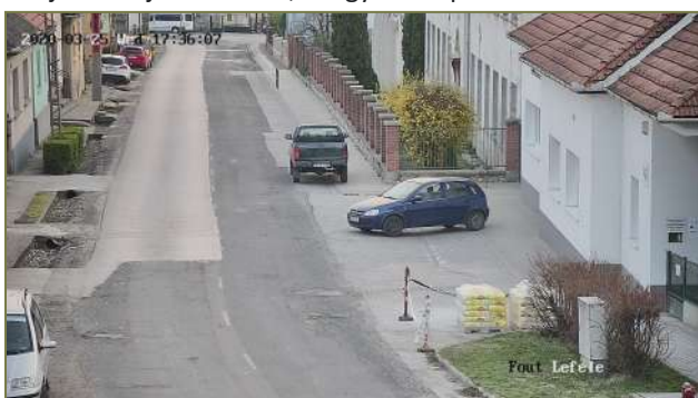
Kamerakép a művelődési házból

megkezdődött a rendszer működése. Jelen bejegyzésünkkel szemléltetjük az újonnan létesített kamerák által figyelt területet. További jó hír, hogy az Önkormányzatnak köszönhetően lecseréltük a falu elején, illetve végén található kameráinkat is, így egy precíz és használható rendszerrel rendelkezhet a település.