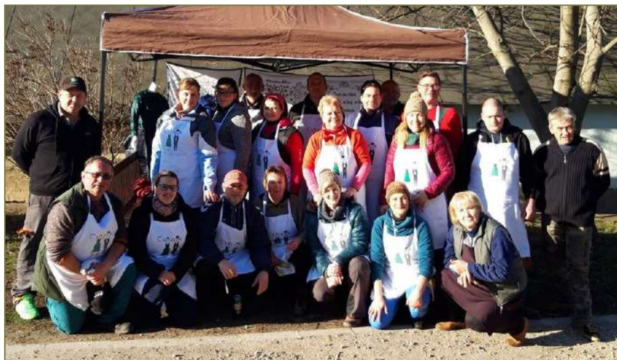
A disznóvágás lelkei, a siker kovácsai