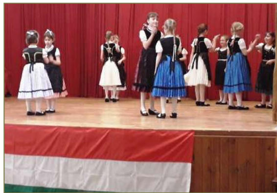
A legkisebb táncosok vidám előadása