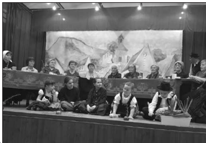
A csolnoki sváb kör előadása

A Dunaharasztirol érkező Blumenstraus kórus énekével, jeleneteivel elvarázsolt bennünket. Elsőként a Blümchenstraus kis csapata mutatta be tudását, ezt követően pedig a felnőttek ismertették meg a közönséggel a haszti sváb esküvői szokásokat, majd következett a csolnoki sváb kör előadása: „Hajdanán állt egy malom” címmel. Öröm volt hallgatni történeteiket, énekeiket a mi szép tájszólásunkban. Nagyon szépen köszönjük ezt a tartalmas szép napot a szervezőknek, a Német Nemzetiségi Önkormányzatnak!