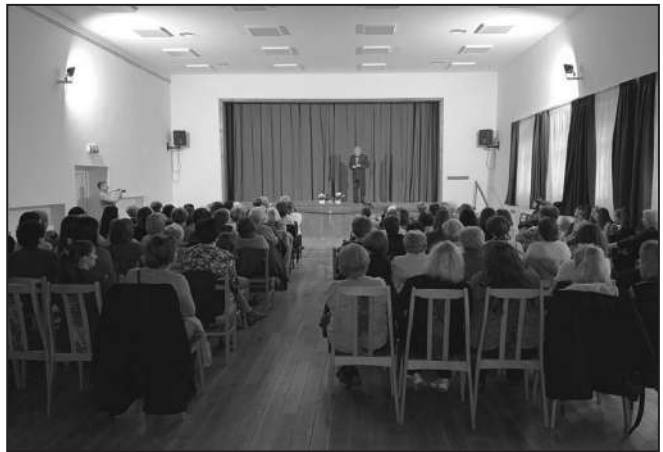
A remek hangulatú előadásra sokan voltak kíváncsiak