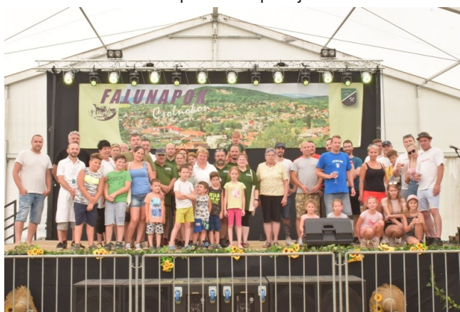
A főzőverseny kiváló fogásainak alkotói

A délutáni program az eddig megszokottaktól eltérően alakult. A rendezvényparkban a kétfős Dorszen Akusztik műsorát élvezhettük. A nemzetiségi délután a Szent János parkban került megrendezésre.