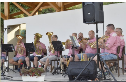
Az Altsteiner zenekar