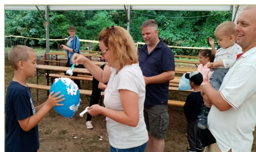
Többek között szék öltöztetés, diótörés és lufi borotválás tette próbára a versenyzőket