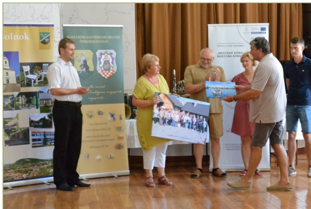
A bokodi küldöttség értékes ajándékokkal érkezett hozzánk