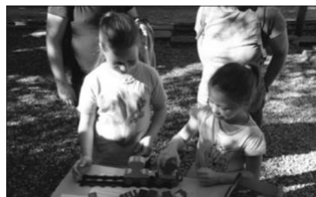
Ötletes mozdonyokat építettek a gyerekek lego elemekből