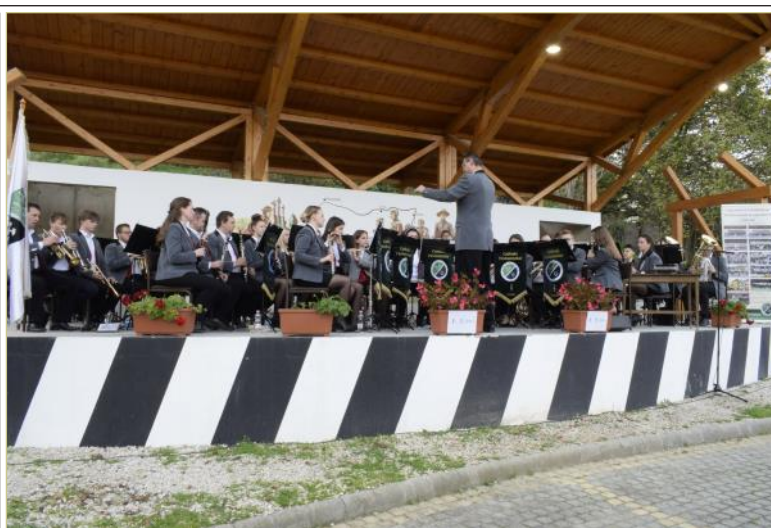
A Zene Világnapján a Szent János parkban találkozhattunk a Csolnoki Fúvószenekarral. A sportcsarnok felújítása miatt szabadtéri koncert mellett döntöttek, az égiek velük voltak, ők is biztosan kíváncsiak voltak a remek muzsikájukra. A csapat jövőre több meglepetéssel is készül, már nagyon várjuk további szerepléseiket, rendezvényeiket!

Hivatali időben vásárolható meg. Az ára: 1500,- Ft/db