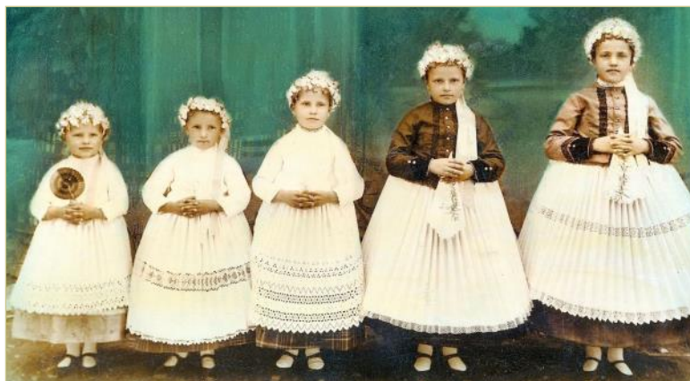
Schmidt István: Geschwister in Tscholnok. 1936 Döntős lett, így az asztali naptárban láthatjuk nyomtatásban