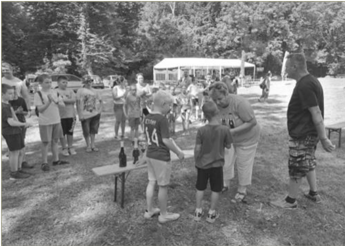
A Faludrby eredményhirdetése. A végeredmény: 1. Csolnoki Ifjak, 2. Terrakotta, 3. Csolnoki Csibészek, 4. Névtelenek