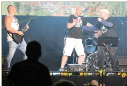
A helyi rockbandához még egy vendégénekes is csatlakozott

2019-ben találkozhattunk legutóbb csolnoki újrashasznosító barátainkkal, a falunapok színpadán. A majdnem tíz-