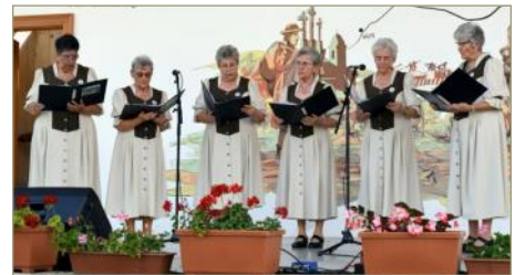
A Csolnoki Nyugdíjas Klub kórusa a színpadon.