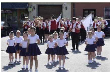
A Dimenzió mazsorettek a felvonuláson