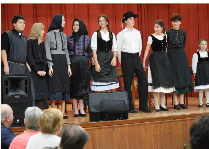
Klinger Szepi Vede „Janza” című darabjának színre vivői

dik osztályos diákunk csengő hangon adta elő az „Es verliebt sich einst ein Junglich” című dalt, ezzel vezette fel a nagyobbak darabját.