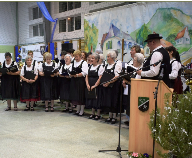
Die drei örtlichen Chören singen zusammen A három helyi kórus együtt énekelt a bálón