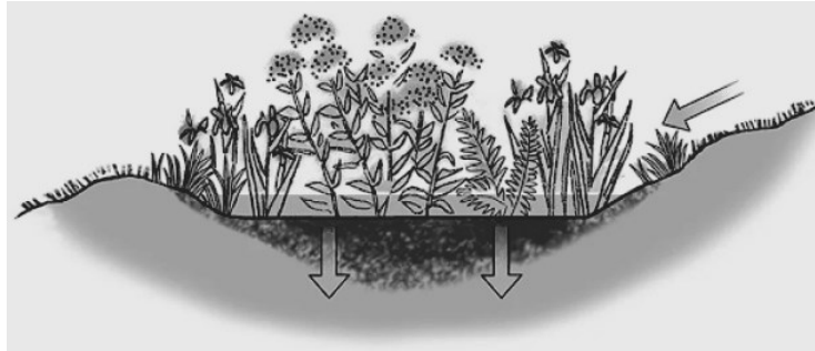
Az esőkert működése

- viacolor, aszfalt, beton burkolat helyett használjunk olyan burkolatot, pl. gyeprácsot, mely átengedi a vizet a talajba. A természet kiváló tanítómester, hagyjuk kicsit szabadjárá, fedezzük fel őseink régi megoldásait.