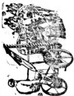
Jó és megbízható aratógépet