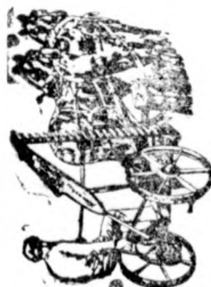
Jó és meghítható aratógépet