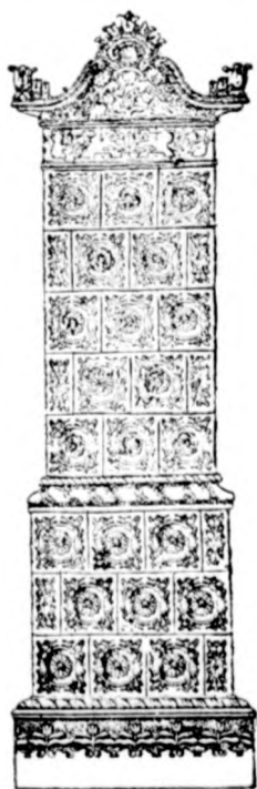
Cserépkályha raktár Nagykőrösi útea 235. az udvarban.