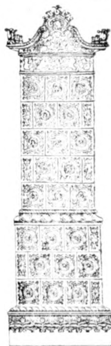
Cserépkályha raktár Nkőrösi utca 235. az udvarban

ház. II. tized, Hegy-utca 87. számú ház, mely áll 5 szoba, 2 konyha és a szükséges mellékhelyiségek, — szabadkézből azonnal eladó. Felvilágosítás ugyanott nyerhető a tulajdonosoknál. 936