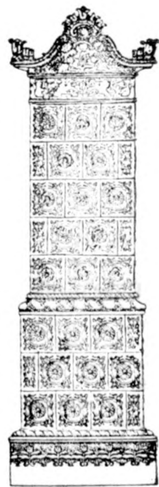
Cserépkályha raktár Nagykovácsi útca 235. az udvarban

Készíték terakotta és majolika épületdíszeket