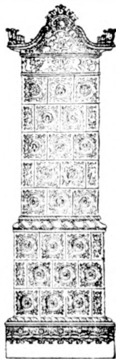
Cserépkályha raktár Nagykörösi utca 235. az udvarban.

Kokszfűtésre 70 százalék tüzelő-anyag megtakarítása mellett igen kellemes, egészséges melege van. Elfogadok fürdőszobák berendezését. Készíték terakotta és majolika épületdíszeket