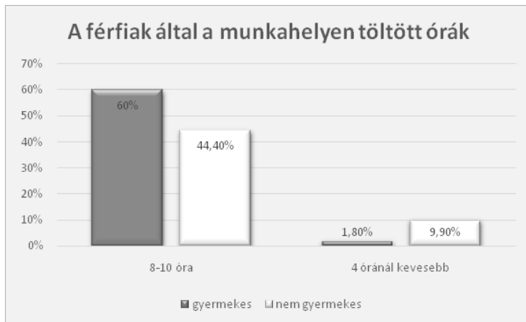
1. ábra. A férfiak által a munkahelyen töltött órák (%)