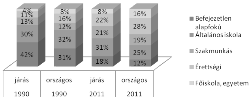
4. ábra: A Berettyóújfalui járás és Magyarország népességének iskolázottsági arányai