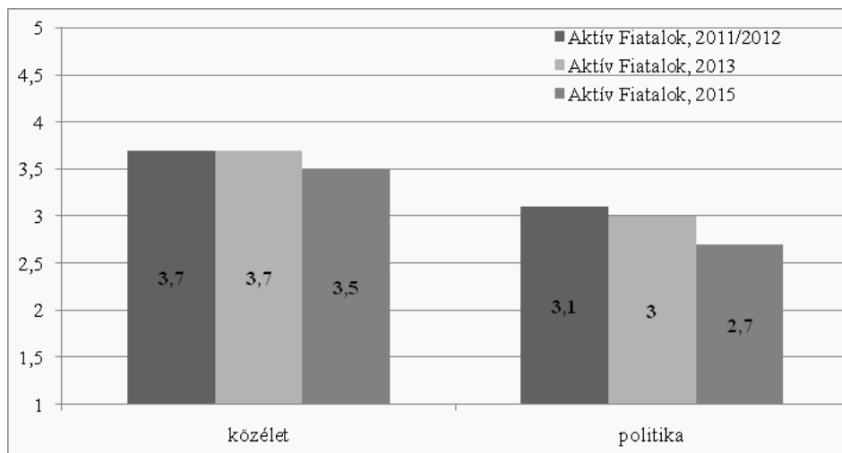
1. ábra. A közélet és a politika megítélése az egyetemisták és főiskolások között, 2011/2012, 2013 és 2015 1-től 5-ig terjedő skála átlagai (1 = egyáltalán nem érdekel, 5 = nagyon érdekel)