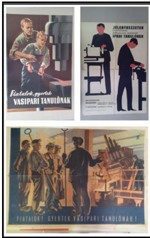
1. ábra. Korabeli toborzási propaganda