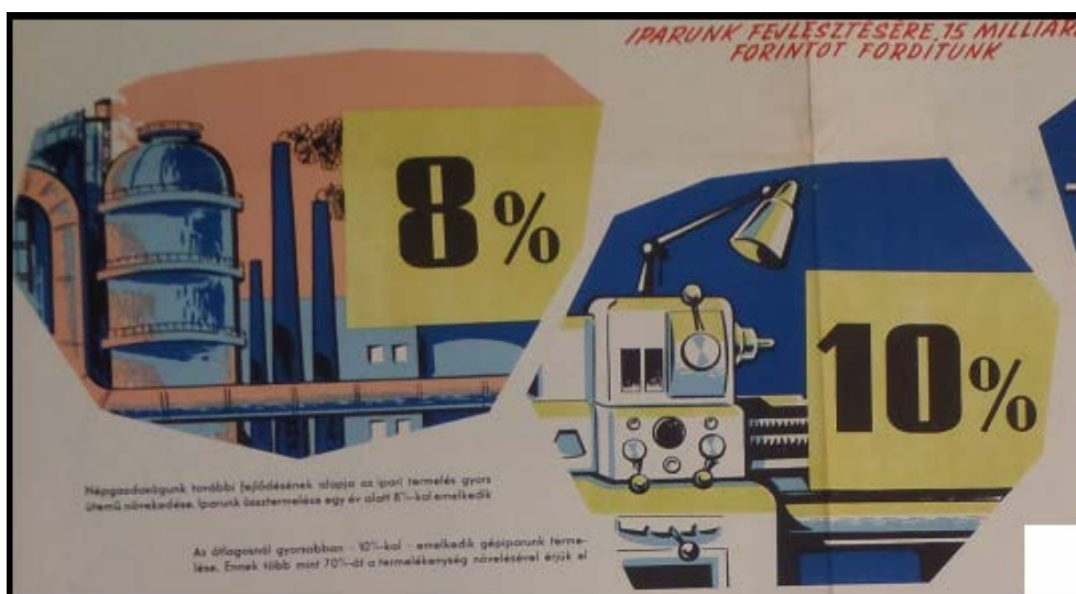
3. ábra. Mérsékeltabb áramlatok a teljesítményképzelésekben