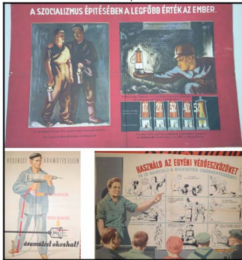
4. ábra. Az ember szerepe az értékteremtésben