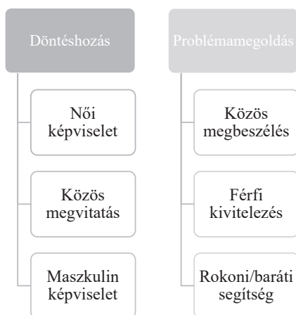
2. ábra. A döntéshozás és a problémák megoldásának csoportosítása

„A mama, testvérem, de nagyon nagy a család. Bármikor tudnék sok mindenkinek szólni. Van kinek szólni.” (Otthon maradó, foglalkoztatott 34 éves nő)