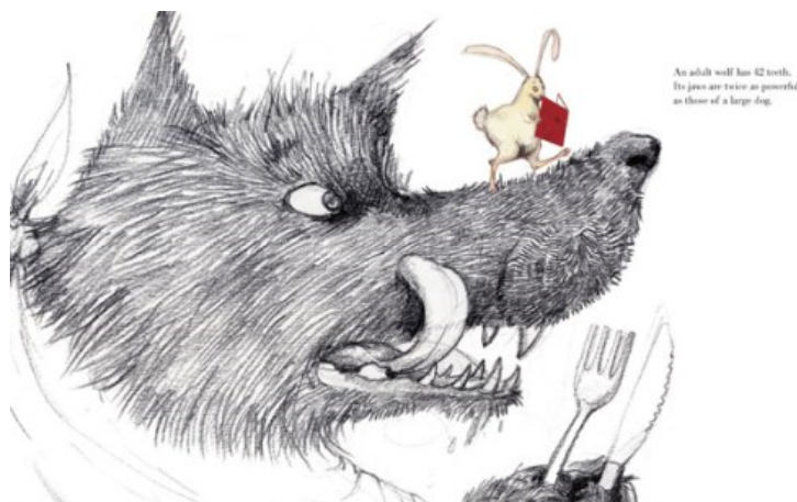
2. ábra. Illusztráció Emily Gravett Wolves című képeskönyvéből.

lepszist alkalmaz, vagyis a farkas figurája átlép saját narratív szintjéről a nyúl hozzá képest extradiegetikus világába. A határ átlépése „kísérteties” hatást kelt, megszünteti az eredetileg otthonos világ nyugalmát: megsérül egy episztemológiai határ az egymást keretező, egymásba ágyazott fikciós szerkezetekben: a képzelt alak irracionális módon tör be a hozzá képest valóságnak tűnő világba, ahol halálos fenyegetést jelent.