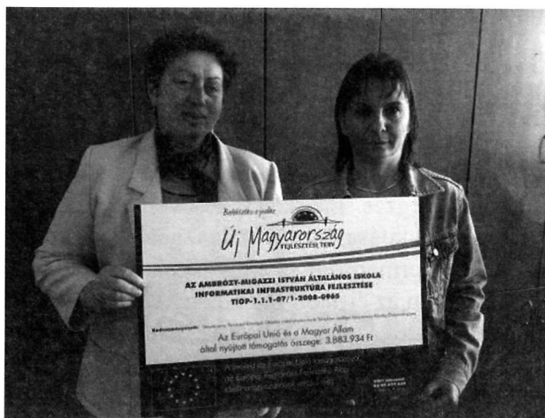
Zsolnai Zoltán polgármester

Az Ambrózy – Migazzi István Általános iskolában Informatikai Infrastruktúra fejlesztése 3.883.934,- Ft támogatás nyert az önkormányzat, mint az intézmény fenntartója. Négy tanterembe került a fejlesztéseknek köszönhetően elektronikus tábla és számítógép, melyek használatához betanítási segítséget is igénybe vehettek a pedagógusok a pályázat keretein belül. A projekt pénzügyi elszámolása befejeződött, melyből az önkormányzat pénzügyesei is kivették részüket. A pályázati támogatásról szóló tájékoztató tábla az iskolában kerül elhelyezésre.