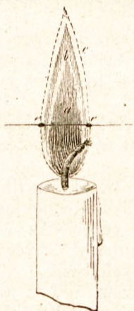
21. ábra. A stearingyertya lángja: sötét kúp a ; világító burok b és a külső köpeny c .

Éghető anyagaink egyrésze — miként ismeretes — lánggal ég, más része a nélkül. Lánggal csak azon testek égnének, melyek gázalakúak (pl. világító-gáz), vagy elégésök előtt ilyenekké változnak át (pl. stearin, faggyú, borszesz). — Lángjok ismét vagy világít, vagy nem. Világít akkor, ha belsejében izzó, szilárd anyag van (pl. szén, kréta), különben csak meleget fejleszt (pl. a borszesz és hidrogén lángja). Oly éghető testek ellenben, melyek szilárdak és a hőségben is szilárdak maradnak (pl. a tiszta szén), csakis izzás tüneteméye között, láng nélkül égnének el.