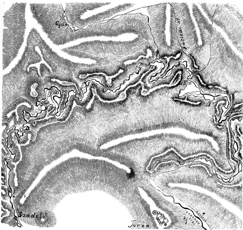
A szádelői völgy alaprajza.

kal hasonlítgatnunk s bárhol s bármikor jutunk a földrajzi oktatás folyamán valamely oly részlethez, melyet tüzetesebb tárgyalásra méltónak tartunk, soha se feledjük el, hogy a tárgyalt részlethez hasonló részletet hazánkban is kell keresnünk s azt is tüzetesebben