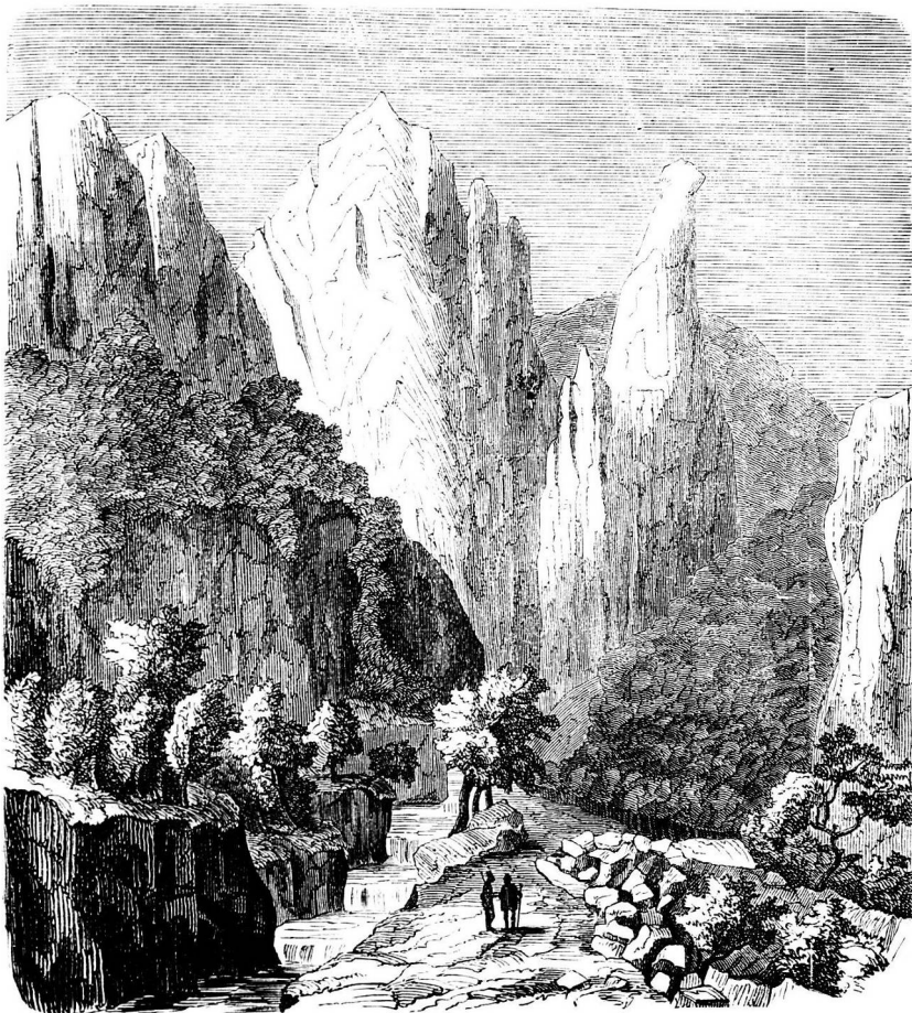
A fűrő kő.

tették a kis Tornamegyét Abaujmegyével? Melyik délkör alatt fekszik Tornamegye? Hány perczel kel fel a nap Tornában korábban mint a Szász-Svájczban? Mennyivel kisebb Torna Szászor-