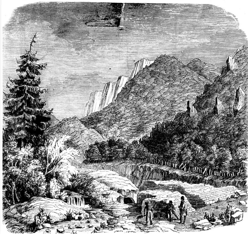
Szárpatak kettős forrása és a darázkobánya.

Ezen II. kép a völgy szűk nyílását mutatja a tornai országút felől. A meredek sziklák alján ott áll a völgyből kisiető Szárpatak