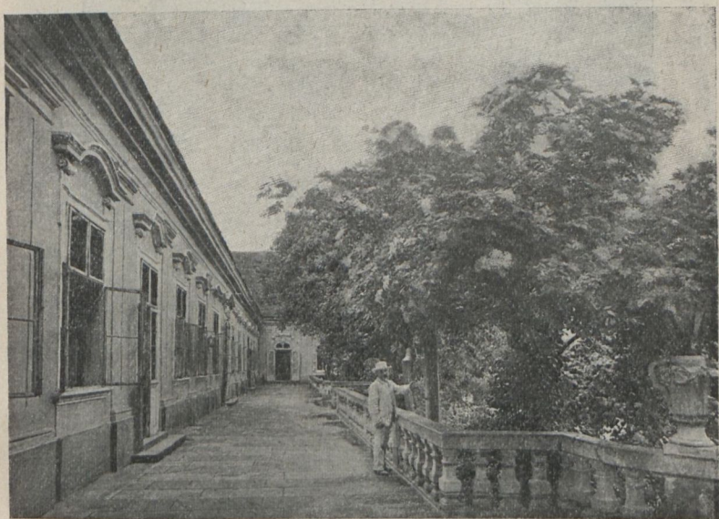
Középrész a nagy nyílt folyosóval.

A közel száz helyiséget tartalmazó pompás kastélynak már külső szemlélése is nagy hatással van a látogatóra s a hatás csak fokozódik az épület belső helyiségeinek megtekintésénél.