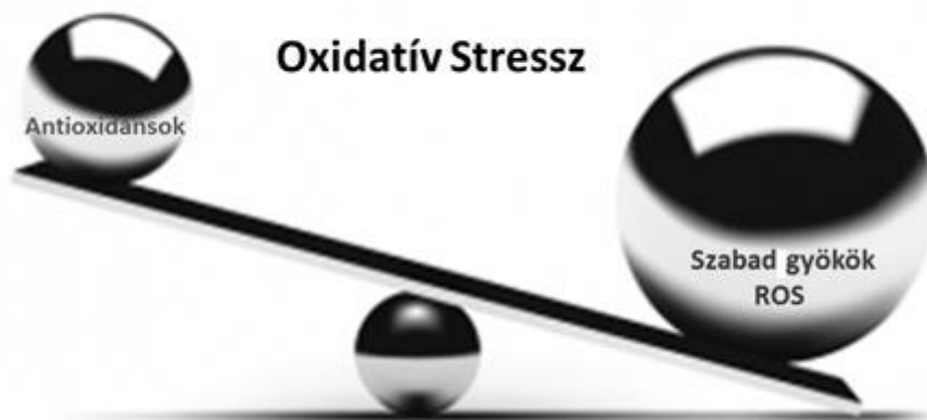
1. ábra: A szabad gyökök/reaktív oxigén és nitrogén tartalmú intermedierek termelődése és a semlegesítésükre hivatott antioxidáns rendszer közti egyensúly megbomlása oxidatív stresszállapotot jelent.

A tartósan fennálló oxidatív stressz a szabad gyökök mennyiségének megnövekedése révén szervezetünk számos, vagy akár az összes folyamatát érintheti. Az oxidatív stressz alapvető szerepét nagyon sok betegség hátterében, kialakulásában leírták. A teljesség igénye nélkül olyan betegségek szerepelnek a listán, mint a szívinfarktus, a gutaütés (stroke), gyulladásos betegségek, szürkehályog és az érlemezés. A szabad gyökök káros hatásait kivédő antioxidánsokra így sokáig afféle Szent Grálként tekintettek, mely szinte minden betegségtől megóvjá a szervezetet.