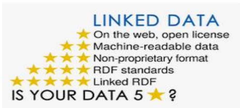
2. ábra.

Tim Berners-Lee, a WWW alapítója a nyílt adatok értékelésére egy ötös skálán alapuló értékelési rendszert javasol. A maximális öt csillag eléréséhez szükséges adatok: