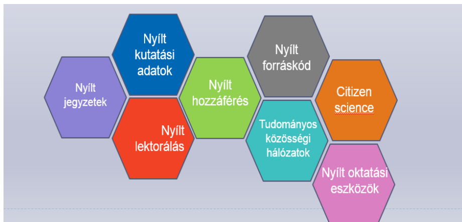
1. ábra.

A nyílt tudomány legfontosabb ismérvei: átláthatóság, teljes hozzáférhetőség, szabad elérhetőség és az ingyenesség. A kutatási adatokhoz való nyílt hozzáférés például alapjában változtathatja meg egy-egy tudományterület helyzetét és pozitív értelemben jelentős felpezsdülést okozhat. De komoly kérdésként merül fel az adatok hosszú távú hozzáférhetőségét biztosító megoldások pénzügyi költsége. A szabad forráskódú ingyenes szoftverek használata korábban jelent meg az OA mozgalomnál, de csak az utóbbi néhány évben beszélnek előnyeiről a kutatásban: többen vehetnek részt a fejlesztésében, a hibákat jobban megtalálják és az eredmények jobban összehasonlíthatóak lesznek. A nyílt lektorálás kérdése (Open Peer Review) szintén pozitív eredményeket hozhat a tudományos publikálás folyamatában. Egyrészt jobban biztosítható az átláthatóság, csökkenthető az elfogultság, tévedés. Nem könnyű kérdés, mert egyrészt a bírálók nem kapnak fizetést a folyóiratoktól, és sok időt vesz el a kutatóktól. Megoldást jelenthetne, ha a bírálati tevékenység bekerülne a kutatói értékelési rendszerbe. A nyílt tudomány egyik elemeként szerepel a civil- (vagy közösségi-) tudomány mozgalom, amely egyszerre szolgálja a tudomány népszerűsítését és tudományos kutatási feladatok elvégzését, másrészt lehetővé teszi az érdeklődő amatőrök bekapcsolódását a tudományos kutatás világába sokszor meglepően eredményesen segítve egy-egy tudós munkáját. 6