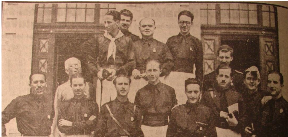
Olaszok a Nyári Egyetemen, 1936.

Magyarország ismét nagy, szabad, hatalmas!” A sorozat végén a város díszvacsorát adott az olasz gróf tiszteletére az Arany Bika éttermében. 18