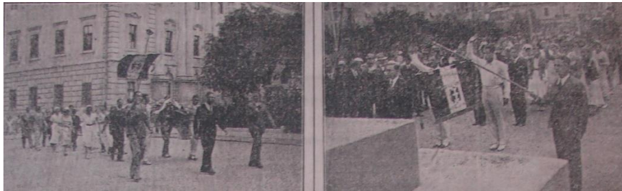
A Nyári Egyetem olasz hallgatói megkoszorúzzák a Kossuth-szobrot, 1931.