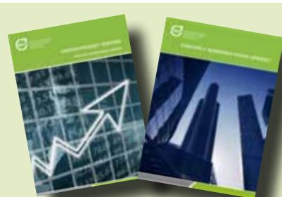
HATÉKONY VÁLSÁGKEZELÉS KAMARAI KIADVÁNYOKKAL

Május közepén jelentettük meg digitális formában Útmutató a nemzetközi piacra lépéshez című kiadványunkat, azzal a céllal, hogy támogató eszközöket, tudásanyagot adjunk a vezetők, a vállalkozók kezébe a kialakult, kihívásokkal teli gazdasági helyzet hatékony kezeléséhez. Amikor egy magyar vállalkozás más földrészre lép, nemcsak az ottani jogszabályi környezettel, de a munka- és a vállalkozási kultúrák különbözőségével is számolnia kell. Ebben a felkészítő szakaszban igyekszünk segítséget nyújtani kiadványunkkal is, melyben helyet kaptak nemzetközi projektek, külficra lépést segítő pályázatok, támogatások is. Tudatos pénzügyi tervezés mikro- és kisvállalkozások számára címet viselő, digitális formában elérhető kiadványunkban aktuális pénzügyi lehetőségeket, kedvezményeket, és a pénzügyi tervezéshez felhasználható ismereteket és sablonokat bocsátottunk a vállalkozók rendelkezésére.