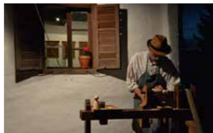
VÁRJUK A PÁLYAMŰVEKET A MAGYAR KÉZMŰVES REMEK PÁLYÁZATRA

bejelentés vagy engedélyköteles-e, illetve mely hatósághoz szükséges fordulni egy esetlegesen fennálló kötelezettség teljesítése érdekében. Az e-TUS nyújt információt arról is, hogy az adott tevékenység folytatásához szükséges-e szakképesítés. Amennyiben egy tevékenység szakképesítéshez kötött, a rendszer tájékoztatást ad a jogszabályban előírt szakképesítés(ek) pontos megnevezéséről, valamint a képesítést előíró jogszabályhelyről is.