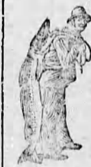
Az Emulsió vasarlásánál a SCOTT-féle módszer vedjéjét — a halaszt — kérjük figyelembevenni.

alakjában élvezik, amely az összes erősítő szerek között a legkiválóbb.