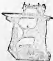
A vidék legnagyobb varrógép raktára. A legtokéletesebb kivitel. 8 évi jótállás.

Raktáron tart és a legelőnyösebb részlet-fizetési feltételek mellett árusít mindenféle mezőgazdasági és varrógépeket, kerékpá-rokat és permetezőket.