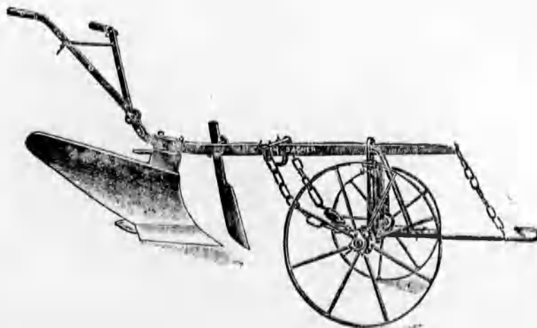
Szakekék minden nagyságban már 43 koroná-tól kezdve.

A legtokéletesebb amerikai lókapaló ara-tó és szántógépeket.