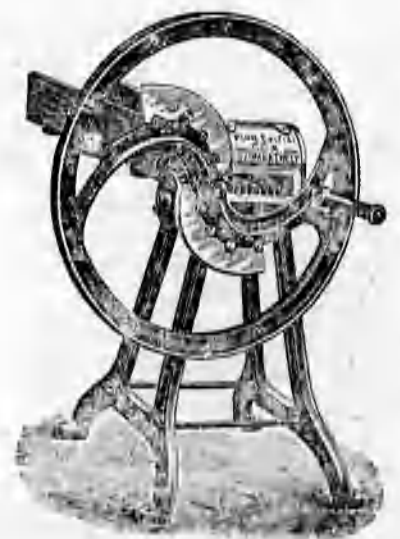
Különféle szecs kavágók 44 koronától feljebb.