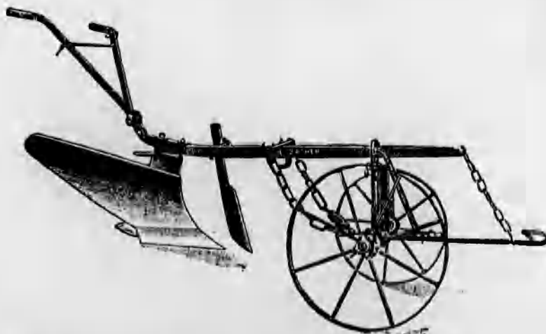
Szakekék minden nagyságban már 48 koronától kezdve.