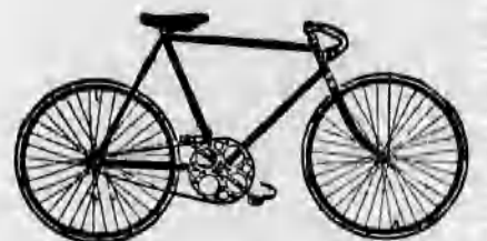
A legtokéletesebb kerékpárok. A Premier gépek egyedárusítása.