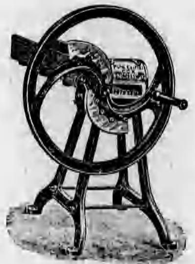
Különféle szecs kavágók 44 koronától feljebb.