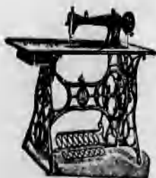
A vidék legnagyobb varrógép raktára. A legtokéletesebb kivitel 8 évi jótállás.