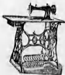
A vidék legnagyobb varrógép raktára. A legelőnyösebb kivitel 8 évi jótallas.