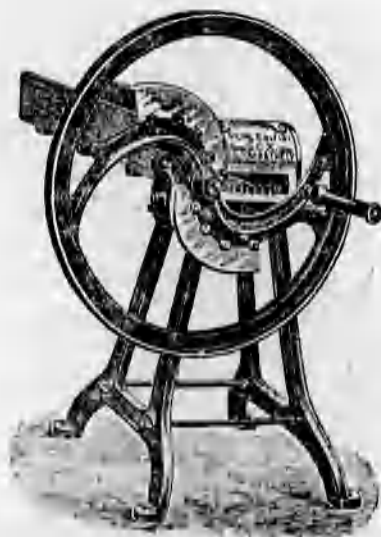
Különféle szecskavágók 44 koronától feljebb.