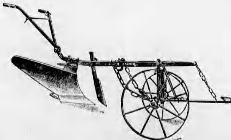
Szakekék minden nagyságban már 48 koronától kezdve.