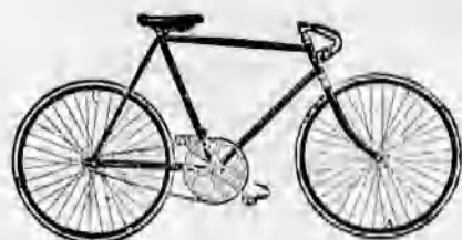
A legelőnyösebb kerékpárok. A Premier gépek egyedárusítása.