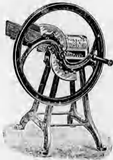
Különféle szecs kavágók 44 koronától feljebb.