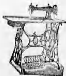
A vidék legnagyobb varrógép raktára. A legelőnyösebb kivitel. 8 évi jótallal.