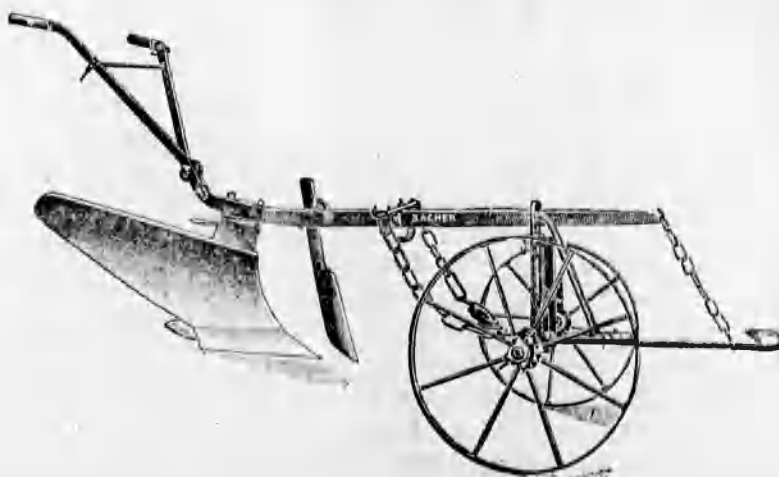
Szakekék minden nagyságban már 48 koronától kezdve.