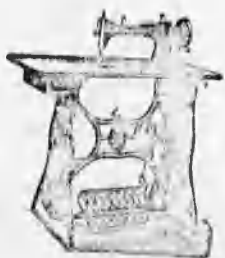
A vidék legnagyobb varrógép raktára. A legelőnyösebb kivitel. 8 évi jótállás.