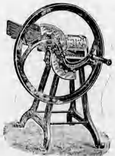
Különféle szecskavágók 44 koronától feljebb.