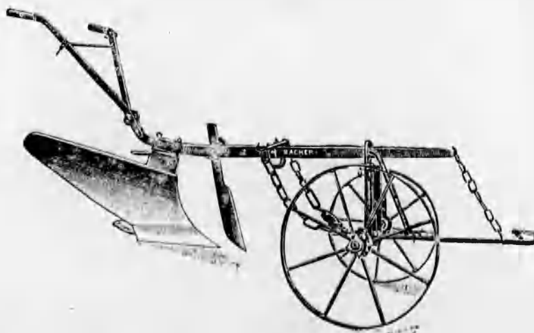
Szakekék minden nagyságban már 48 koroná- tól kezdve.