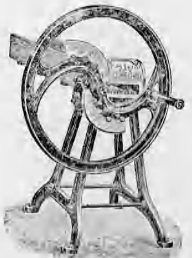
Különféle szecs kavágók 44 koronától feljebb.