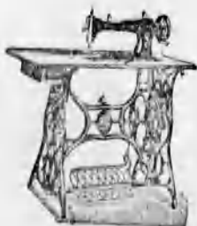
A vidék legnagyobb varrógép raktára. A legtekélyesebb kivitel. 8 évi jótallas.