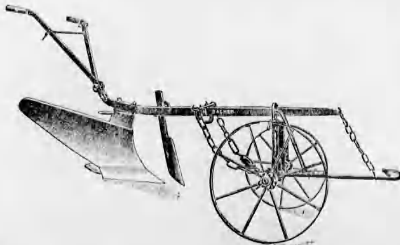
Szakekék minden nagyságban már 48 koronától kezdve.