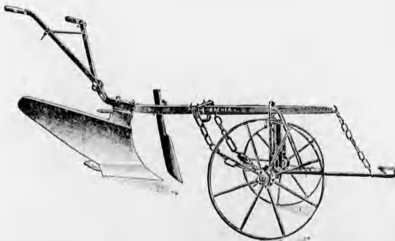
Szakekék minden nagyságban már 48 koroná- tól kezdve.