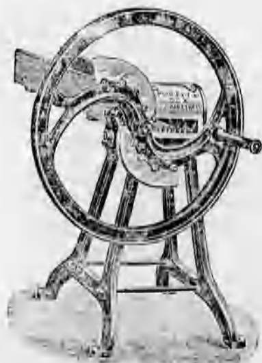
Különféle szecskav g o k 44 koronától feljebb.