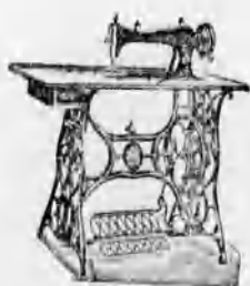
A vidék legnagyobb varrógép raktára. A legtokéletesebb kivétel 8 évi garancia.