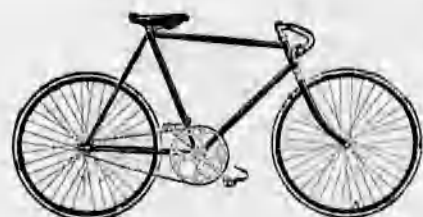
A legtokéletesebb kerékpá- rok. A Premier gépek egyedárusítása.