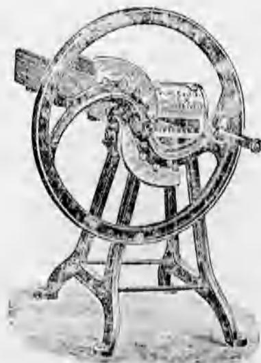
Különféle szecska- vágók 44 koronától feljebb.