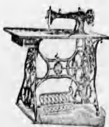
A vidék leg- jobb varrógép raktára leg- kiválóbb szőlő- zúróval és szőlő- zúróval. S. évi jótállás.