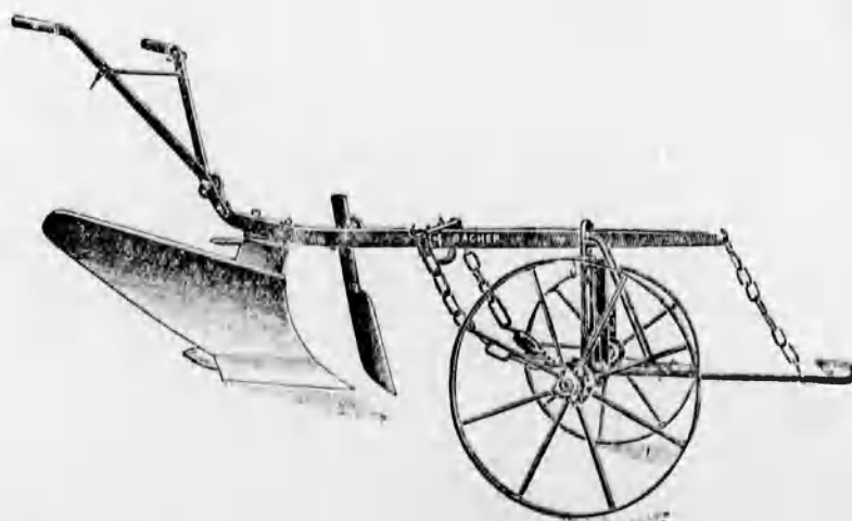
Szakekék minden nagyságban már 48 koroná- tól kezdve.