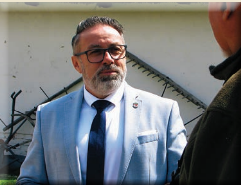
EGYÜTT EGY ZÖLDEBB ÓCSÁÉRT! 3. OLDAL

ÓCSA VÁROS ÖNKORMÁNYZATÁNAK INGYENES LAPJA