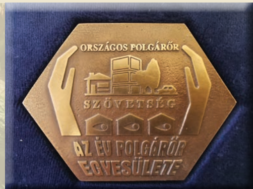
AZ ÉV POLGÁRŐR EGYESÜLETE: ÓVPE 14. OLDAL