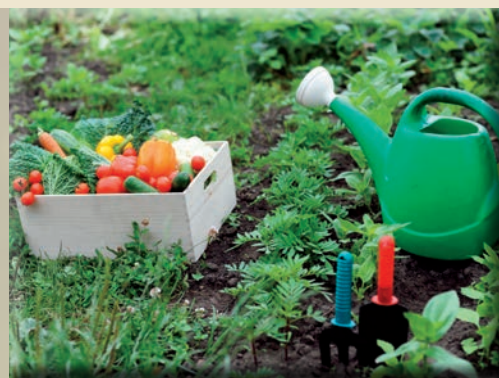
LEGSZEBB ÓCSAI KONYHAKERTEK 14-15. OLDAL