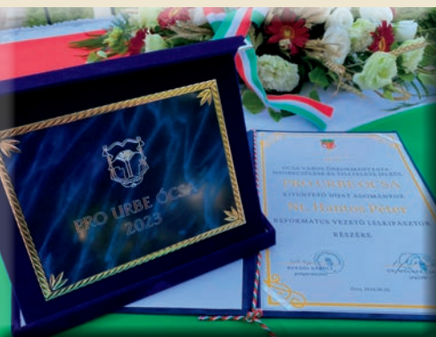
PRO URBE ÓCSA 2023 7. OLDAL

ÓCSA VÁROS ÖNKORMÁNYZATÁNAK INGYENES LAPJA