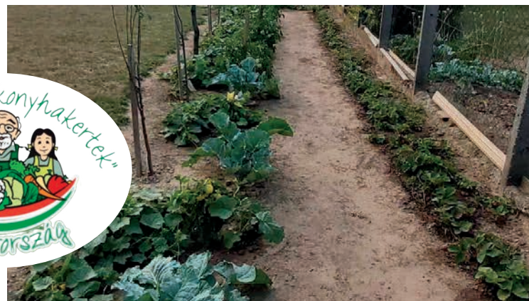
ZÁMBÓ ISTVÁN KERTJE