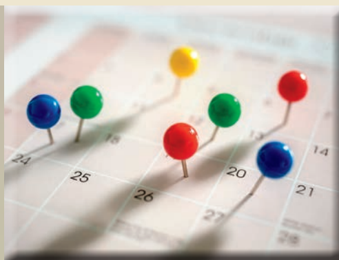
NEGYEDÉVES ESEMÉNYNAPTÁR 10-11. OLDAL