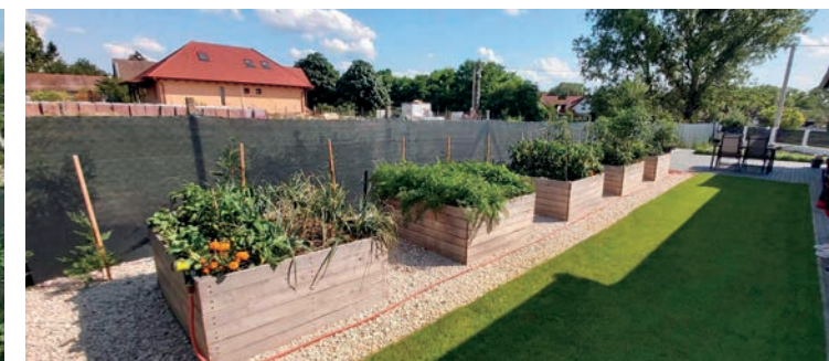
PAUL-HAJDÚ ORSOLYA KERTJE