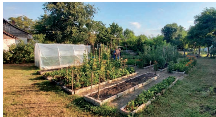
BUKODI KÁROLY POLGÁRMESTER KERTJE