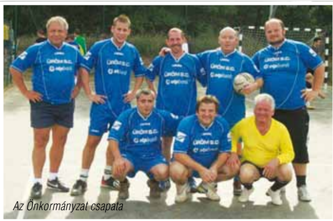
Az Önkormányzat csapata