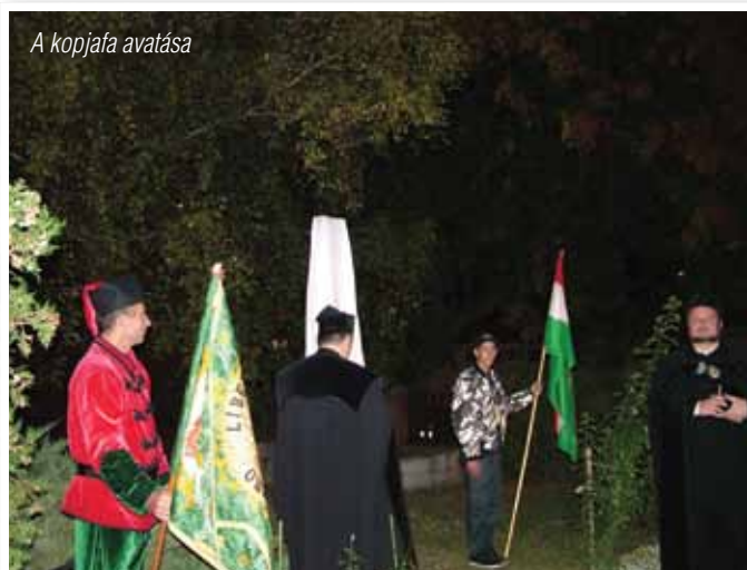
A kopjafa avatása