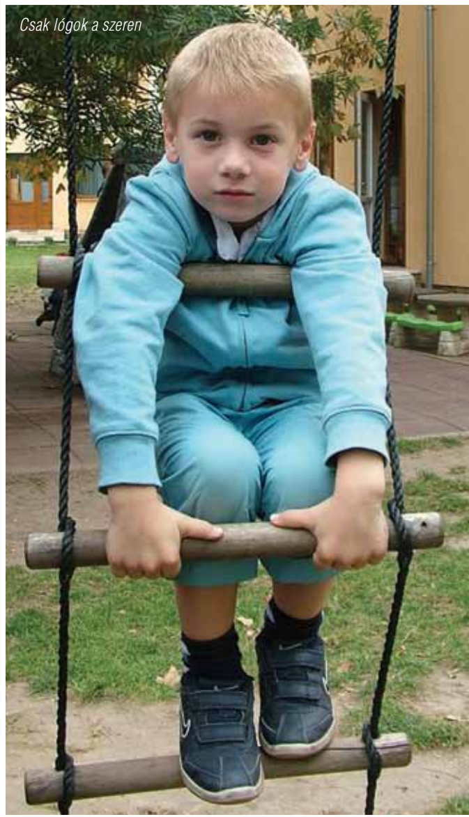
Csak lógok a szeren