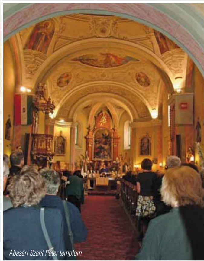
Abasári Szent Péter templom