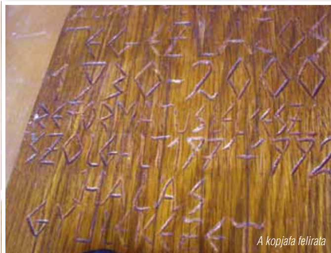
A kopjafa felírata