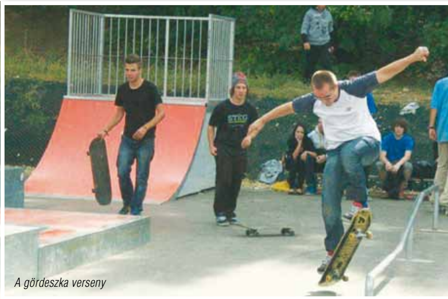
A gördeszka verseny

Este 9 órától hajnali 4 óráig az Ürömi Művelődési Házban zenés összejövetelen lazíthattak az ott megjelentek, melyen szintén korosztálytól függetlenül mindenkit szívesen láttunk. Kék és piros karszalagokkal különböztettük meg a 18 éven aluli, illetve 18 éven felüli résztvevőket elsősorban az alkoholfogyasztás engedélyezése miatt. A mintegy 250 fő szórakozását biztonsági őrök felügyelték. Négy DJ gondoskodott a zenei stílusok változatosságáról.