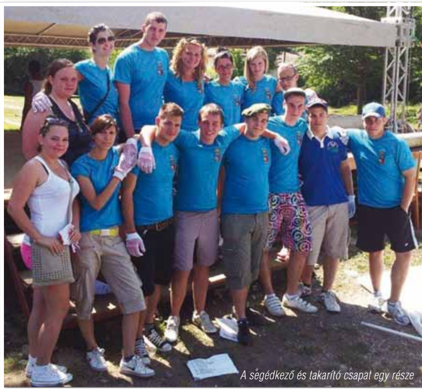
A segédkező és takarító csapat egy része

A kosárlabdában 6 csapat mérhette össze ügyességét. A foci bajnokságon 12 csapat versenyezhetett mind fiúk, lányok és vegyes összetételű csoportok.