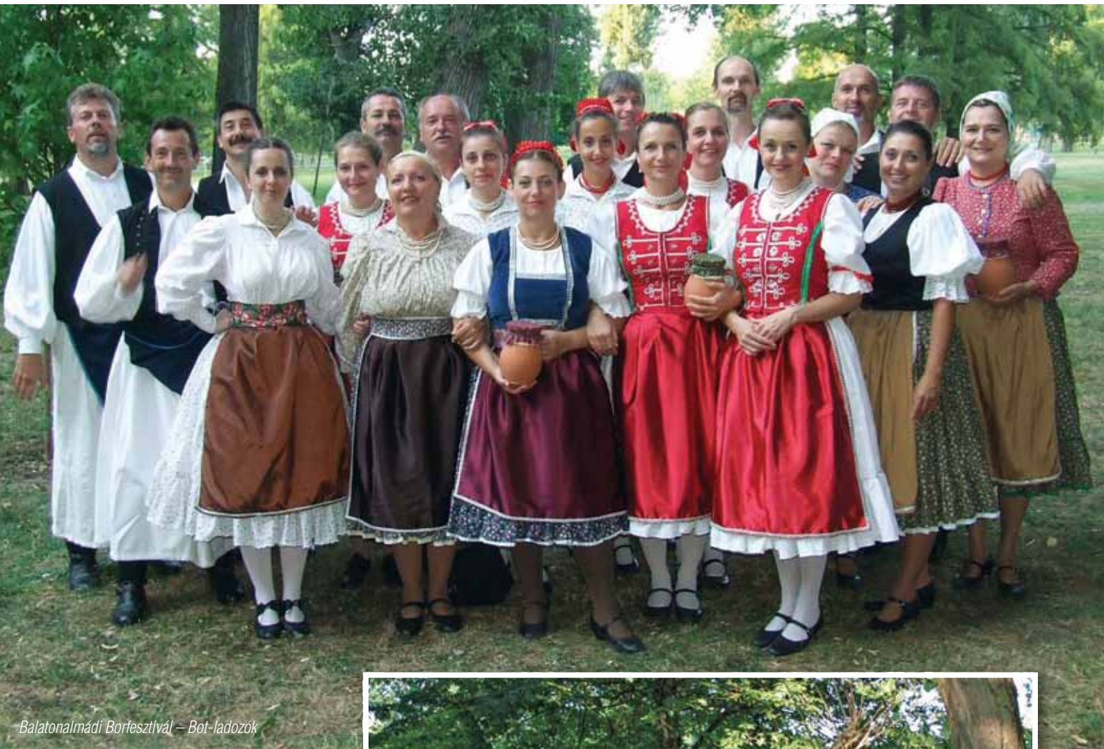
Balatonalmádi Borfesztivál – Bot-ladozók

A csoport ezután dél-felé vette az irányt; immáron negyedik alkalommal láttak vendégül bennünket Balatonalmádi barátaink a náluk megrendezett Borfesztiválon. Az egész napos zenei rendezvény zárásaként, közös műsorral léptünk színpadra, az ad-digra már több százra duz-zadt közönség igen nagy örömére.