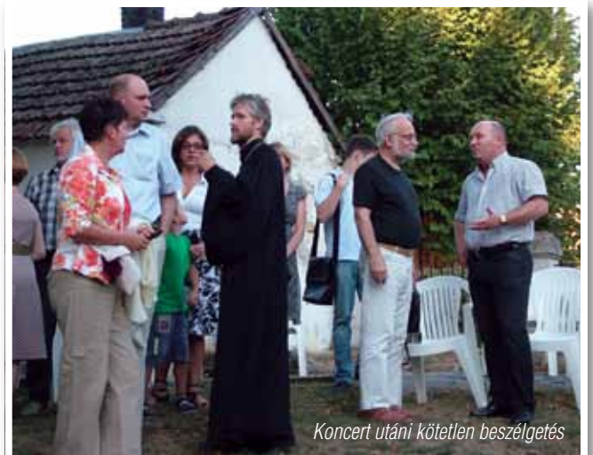
Koncert utáni kötetlen beszélgetés