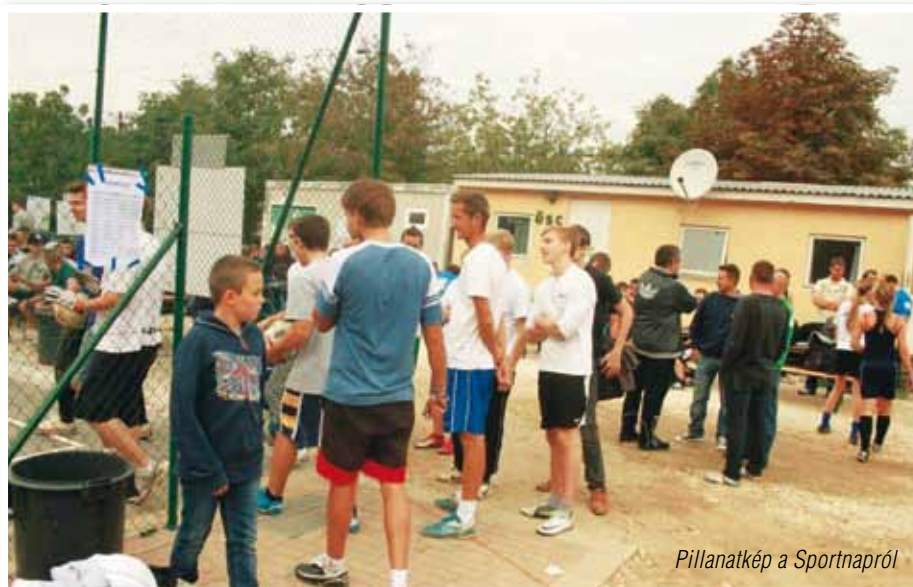
Pillanatkép a Sportnapról

A versenyezni vágyók három sportágban – gördeszka, kosárlabda, foci – mérhették össze tudásukat. Izgalmas és látványos versenyeknek lehettünk tanúi. Felkapottá vált az ürömi fiatalok körében a gördeszka sportága, így minden fiatal nagy öröme szolgálta az új gördeszka pálya megépülése. Ezt igazolja a 17 versenyezni kívánt jelentkező is.