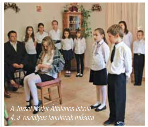
A József Nádor Általános Iskola 4. a osztályos tanulónak műsora