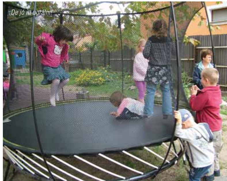
De jó itt ugrálni!

Szembevetve, hogy a bölcsődéből jött gyerekek, mennyivel önállóbbak, ügyesen öltöznek, esznek egyedül, s az ebéd utáni alvás is problémamentesebb, hiszen ők már hozzászoktak, hogy az óvónénik „átvették” az édesanya szerepét. Akiknek az ölébe ülhetnek, s akik simogatásával, puszijával, ölelésével tanítgatja őket sok szépre, és vigasztalja, ha bánatos a kis lurkó. A gyermekek viselkedése