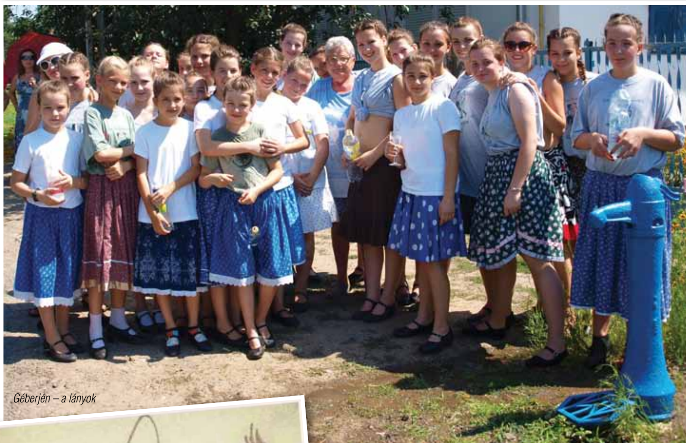
Géberjén – a lányok