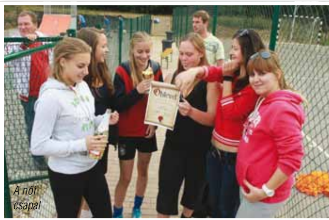
A női csapat