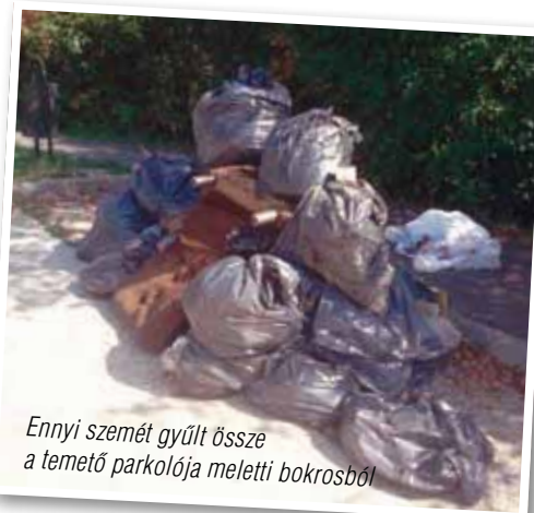
Ennyi szemét gyűlt össze a temető parkolója melletti bokrosból

Profi bírák segítették a játékok levezénylését. Elmaradhatatlan volt a jó zene, a felhőtlen hangulat. Két mérkőzés között a Face Team nevezetű akrobatikus kosárlabdacsapat előadását nézhettük végig.