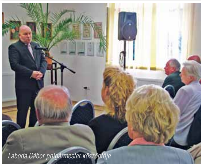
Laboda Gábor polgármester köszöntője