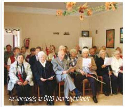
Az ünnepség az ÖNO-ban folytatódott