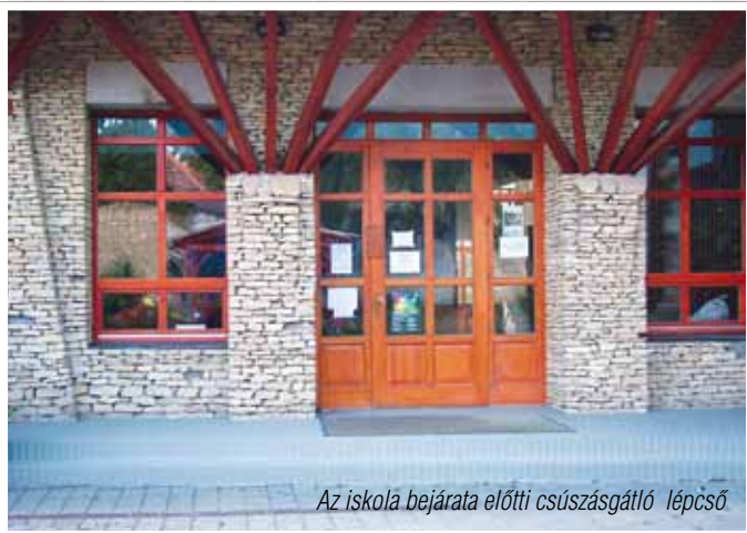
Az iskola bejárata előtti csúszásgátló lépcső