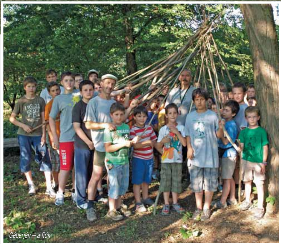
Géberjén – a fiúk

A csoport ezután dél-felé vette az irányt; immáron negyedik alkalommal láttak vendégül bennünket Balatonalmádi barátaink a náluk megrendezett Borfesztiválon. Az egész napos zenei rendezvény zárásaként, közös műsorral léptünk színpadra, az ad-digra már több százra duz-zadt közönség igen nagy örömére.