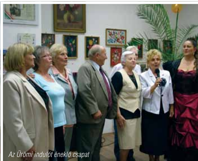
Az Ürömi indulót éneklő csapat