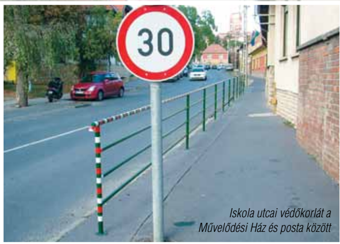
Iskola utcai védőkorlát a Művelődési Ház és posta között