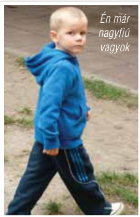
Én már nagyfiú vagyok

játszóterén volt alkalmam más gyerekekkel játszani. S hiába az első „ovis napok” ijedtsége, nem telik el sok idő és mindegyik kicsi rájön, hogy ez bizony nem is olyan rossz hely, hiszen itt mindig van kivel játszani, barátkozni és sokkal-sokkal több a játék, mint otthon.