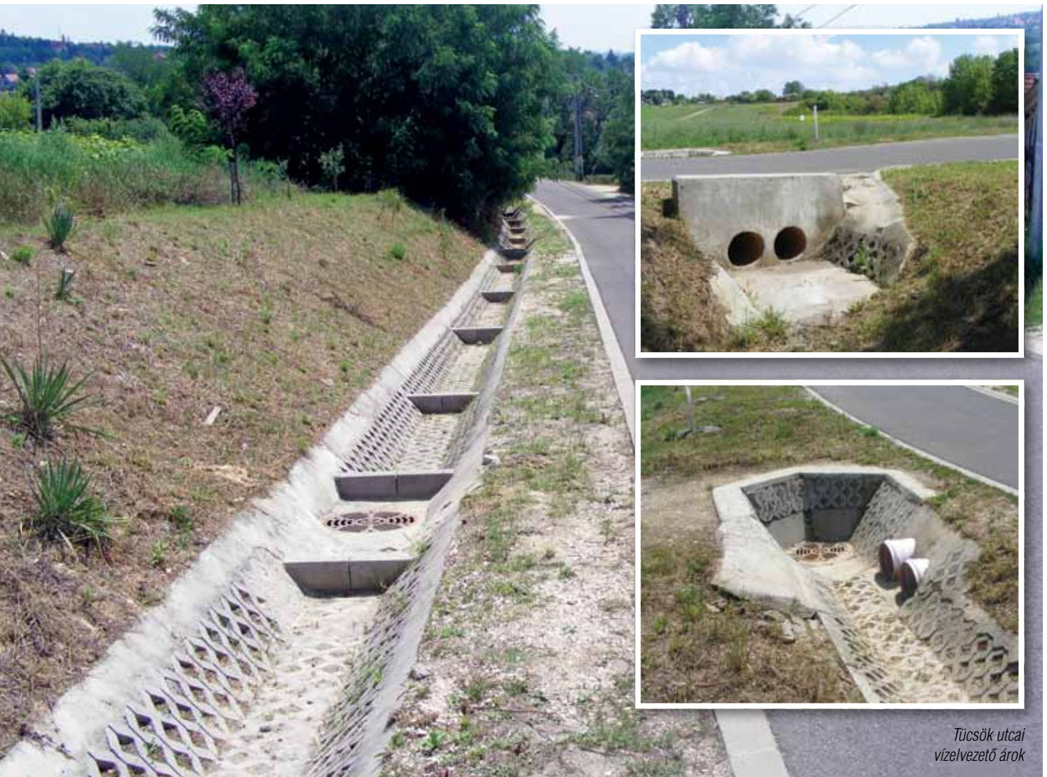
Tücsök utcai vízvezető árok

• Szükségnek tartom ezúttal is tájékoztatni Lakótársaimat arról, hogy a tervezett új orvosi rendelő megépítéséről a végleges döntést még nem tudta meghozni a testület, mivel az önkormányzat 2013. évi finanszírozási kondíciói még nem ismertek. Abban az esetben, ha az új rendelő megépítése pénzügyi okok miatt nem lenne lehetséges, úgy ez esetben is van megoldás arra, hogy az egészségügyi alapellátás helyzete javuljon, a jelenlegi rendelő épületének felújításával, korszerűsítésével.