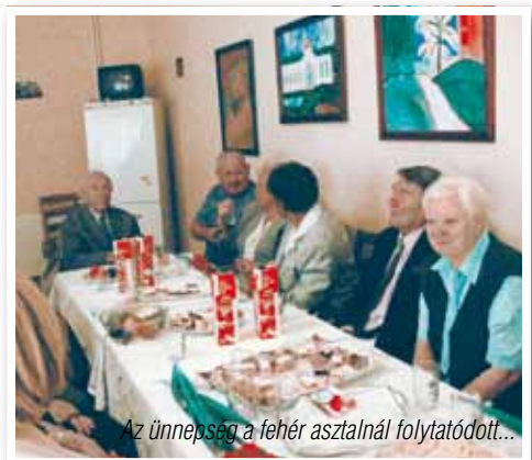
Az ünnepség a fehér asztalnál folytatódott...