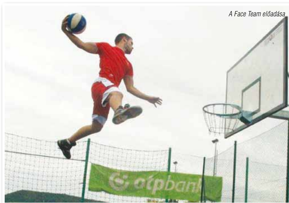
A Face Team előadása

Örömkre szolgál, hogy rengeteg pozitív visszajelzést kaptunk, mind a sportnapról, mind az esti összejövetelről. Bízunk benne, hogy a közeljövőben hasonló programokat rendezhetünk. Célunk, hogy színesítsük a helyi sport és kulturális életet, összehozzuk a helyi fiatalságot és minden más korosztályt.