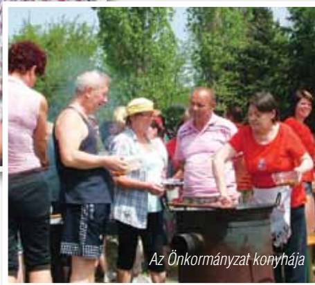
Az Önkormányzat konyhája

A zsűri asztalánál folyamatosan osztottuk a finom házi süteményeket és üdítőket az arra járóknak, amiket a Hagyományörző Egyesület tagjai, az Önkormányzat önkéntesei, valamint a szervezők sütöttek.