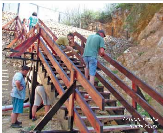
Az Ürömi Fiatalok munka közben

Április 22-én, a Föld Napján a csókavári bányához vezető falépcső festésével igyekeztünk bizonyítani, hogy számunkra is fontos jelentőségű ez a nap, de elsősorban Üröm.