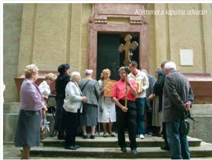
Körmenet a kápolna udvarán