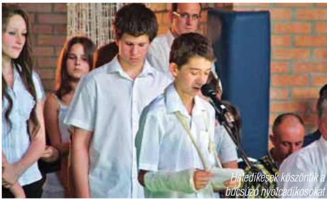
Hetedikesek köszöntik a búcsúzó nyolcadikosokat