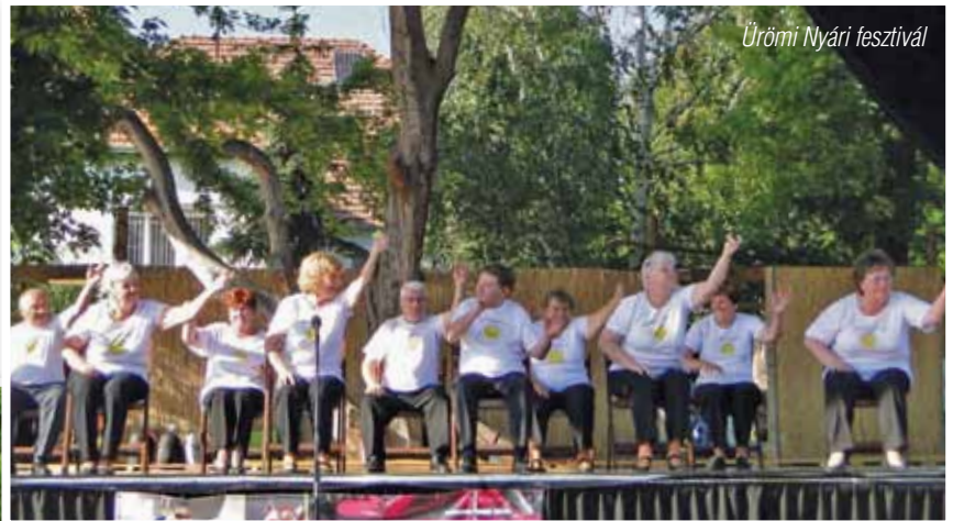
Ürömi Nyári fesztivál

A seniortánc kifejezetten idősebb emberek számára kitalált kíméletes sporttevékenység, ami a speciális mozgásfejlesztő gyakorlatok és koreográfiák