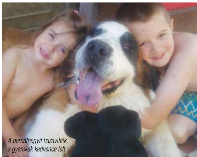
A bernáthegyit hazavitték, a gyerekek kedvence lett

– Nem szeretném őket elaltatni, gyógykezeljük őket és igyek-