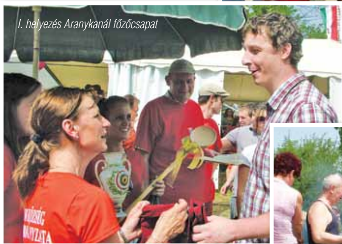
I. helyezés Aranyfakanál főzőcsapat