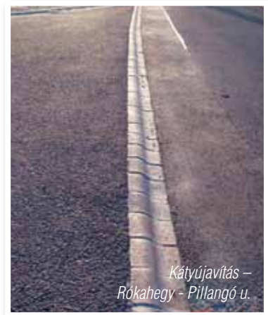
Kátyújavítás – Rókahegy - Pillangó u.