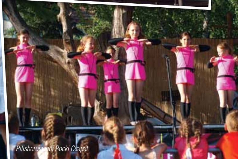
Pilisborosjenői Rocki Csapat

képviselőit, hogy produkciójukkal elkápráztassanak bennünket.