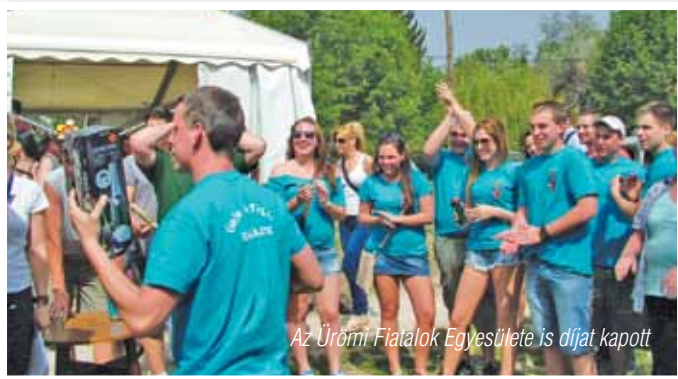
Az Ürömi Fiatalok Egyesülete is díjat kapott