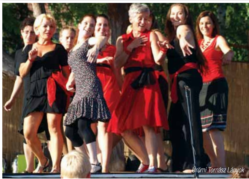
Ürömi Tornász Lányok

Természetesen a műsorok mellett számos kiegészítő kikapcsolódást is találhatott minden kedves idelátogató. Az újonnan épült játszótér közelében gyerekprogramokkal készültünk, vásárosokat és egyéb ilyen jellegű rendezvényeken népszerű árusokat hívtunk, így volt az elamaradhatatlan kürtőskalácsos, édességes,