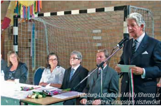
Habsburg-Lotharingiai Mihály főherceg úr köszöntötte az ünnepségen résztvevőket