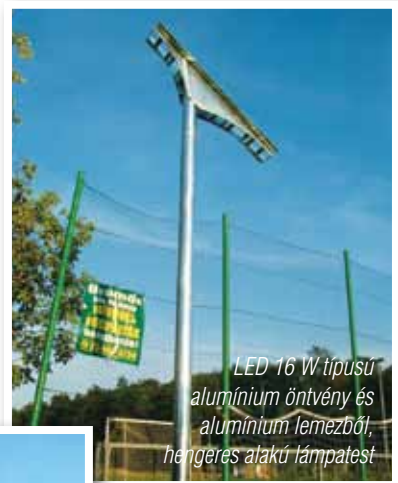
LED 16 W típusú alumínium öntvény és alumínium lemezből, hengeres alakú lámpatest

Napelemes szigetüzemű világítási hálózat kiépítése fog megtörténni. Várhatóan július közepéig a kivitelező Kandeláber Manufaktúra Kft.