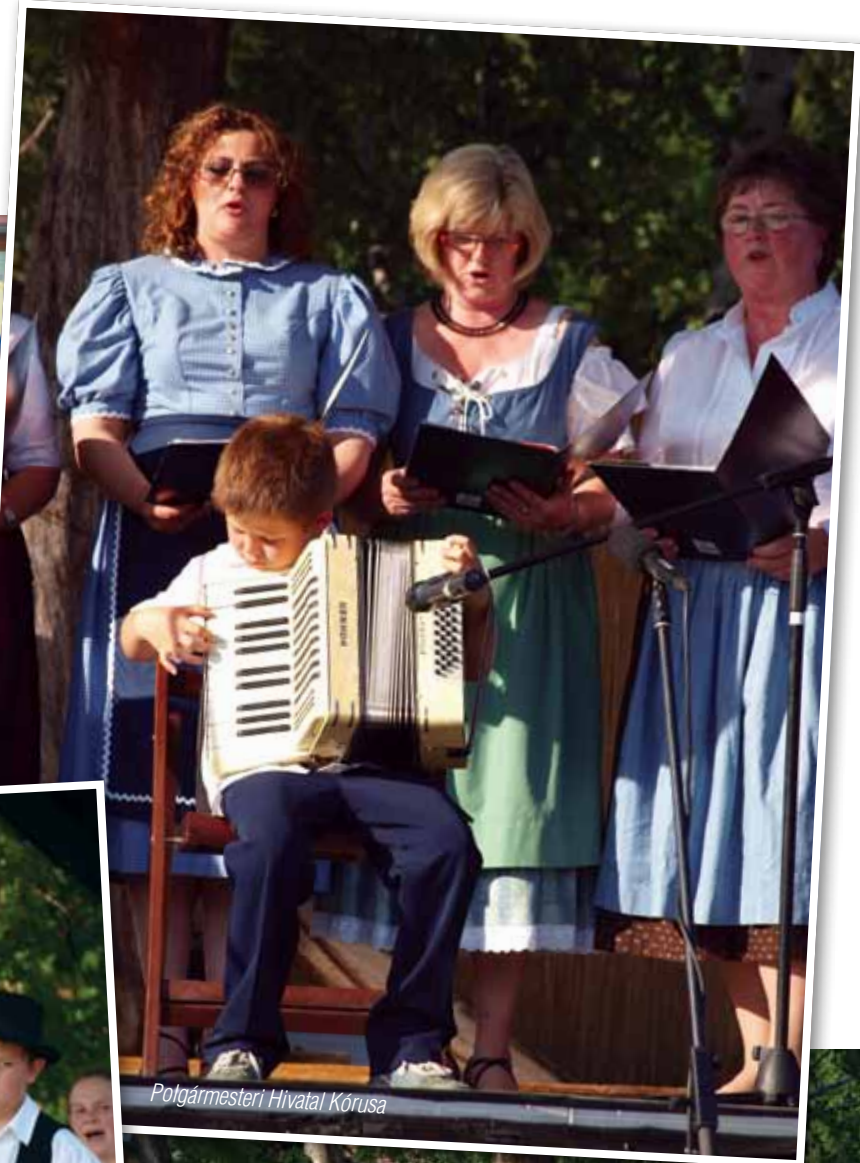
Polgármesteri Hivatal Kórusa