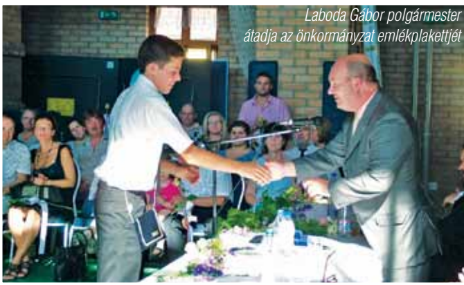
Laboda Gábor polgármester átadja az önkormányzat emléklakettjét