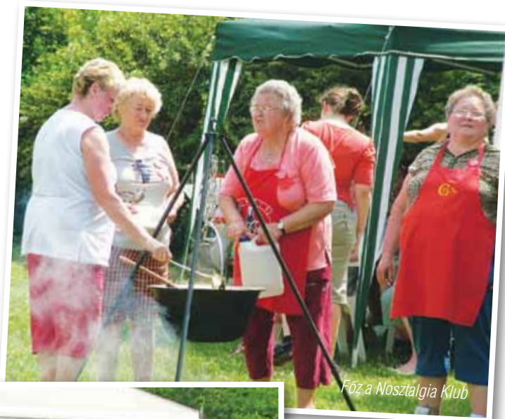
Főz a Nostalgia Klub

Közben egy órákor elindult a zsűri és a benevezett csapatok közül hosszas tanakodás után tudták csak összeállítani a rangsort, de végül megszületett az eredmény: