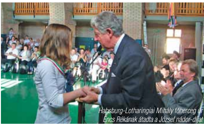
Habsburg-Lotharingiai Mihály főherceg úr Encs Rékának átadta a József nádor-díjat

látásmód kialakításához, mely nélkülözhetetlen a mai modern életben.