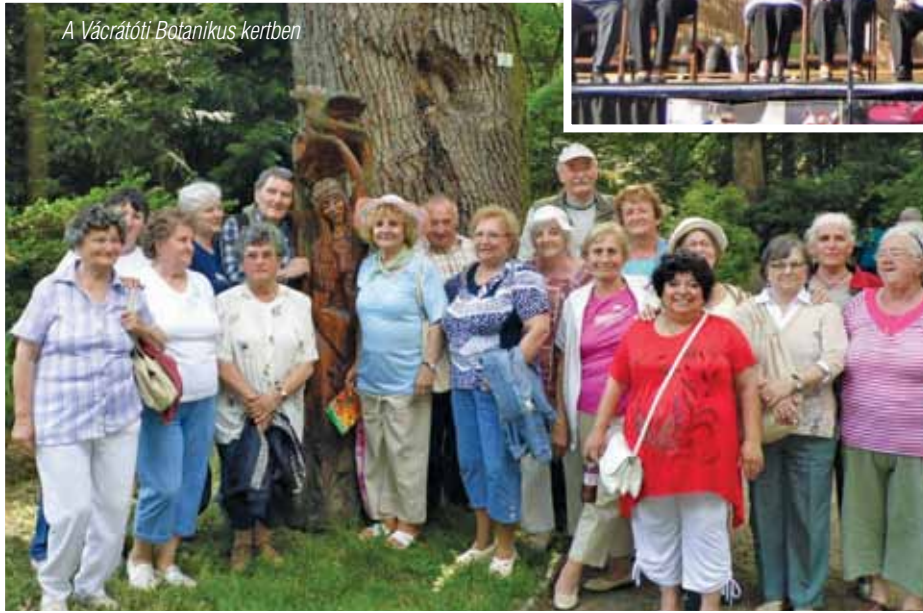
A Vácrátóti Botanikus kertben

főzőversenyen vettünk részt, ahol a Különdíjjal jutalmaztak bennünket.