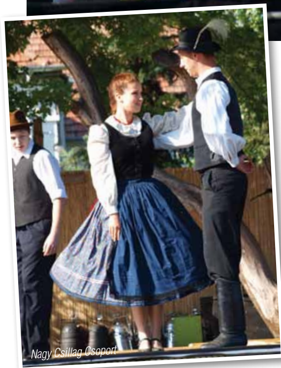
Nagy Csillag Csoport

Az idei évben is megrendezésre került az Ürömi Nyári Fesztivál, melynek főszervezője a Kossuth Lajos Művelődési Ház volt, Üröm Község Önkormányzata és számos egyéni támogató hozzájárulásával.