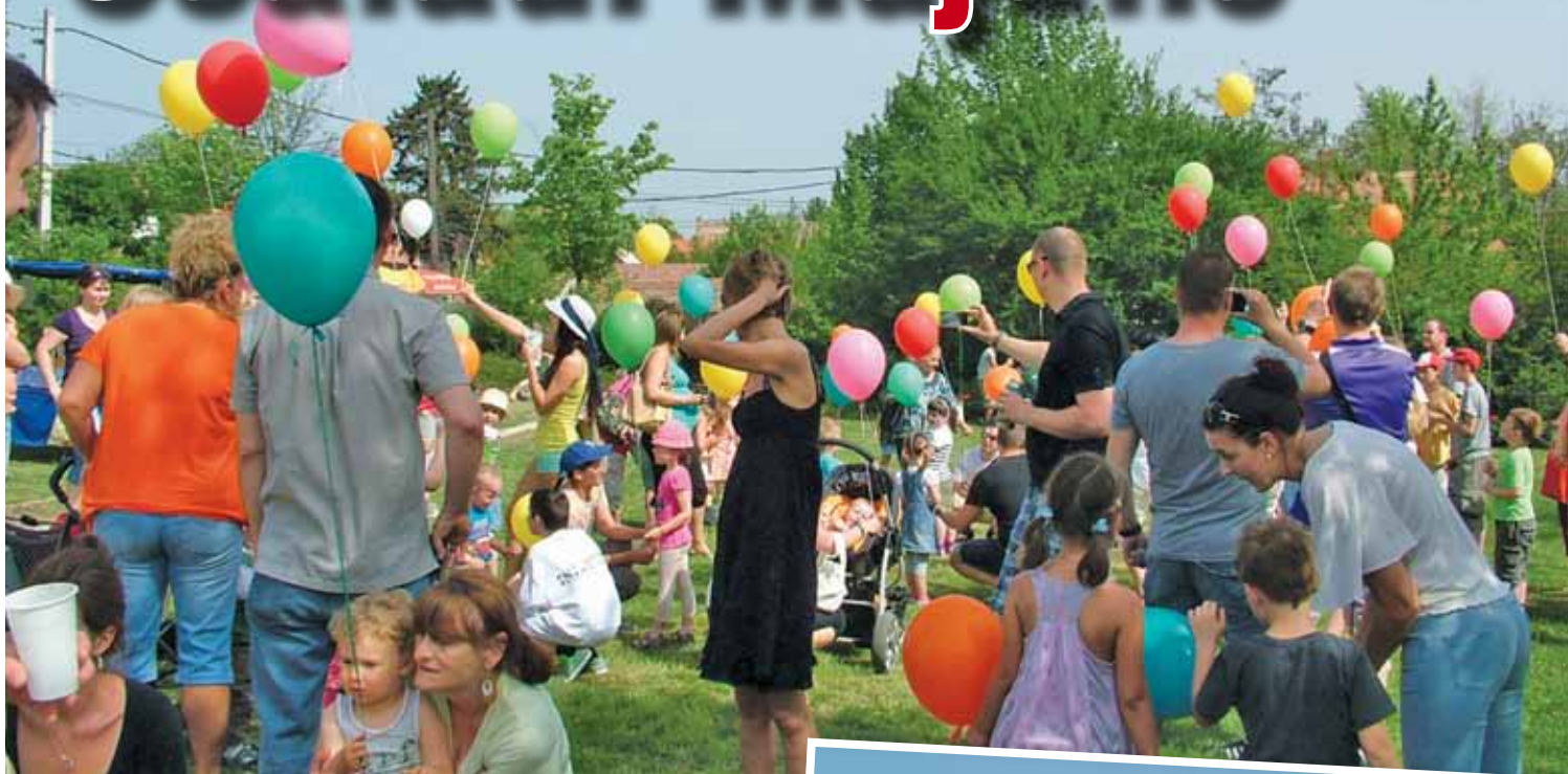
A májusról az idén is levették az üveg bort