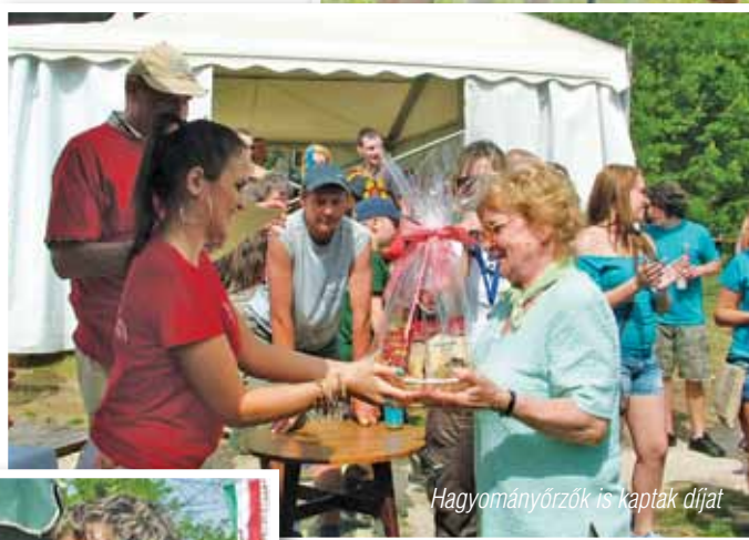
Hagyományörzők is kapták díjat

Különdíj II. Nostalgia Klub – Pusztapörkölt.