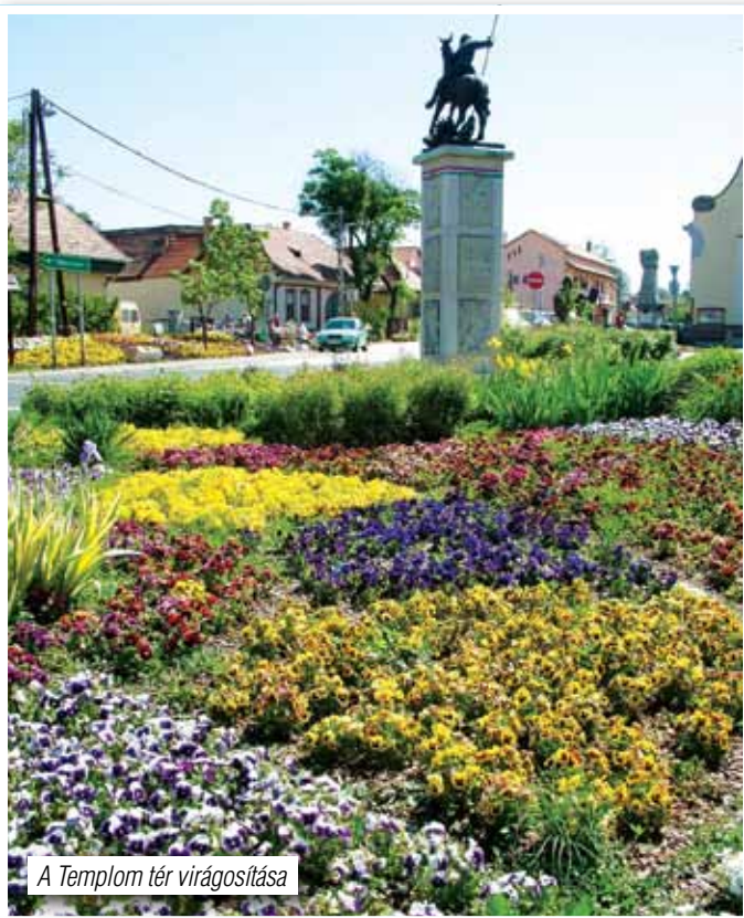
A Templom tér virágosítása