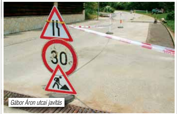
Gábor Áron utcai javítás

iskolabővítésre, fejlesztésre kiírt pályázatokon eséllyel indulni lehessen. A Képviselő-testület által létrehozott eseti bizottság feladata a továbbiakban a munkák koordinálása. Tehát ez azt jelenti, hogy a tervezés során a felelős tervező az adott területen, a meglévő épület és ezek adottságának figyelembevételével, továbbá az érvényes szabványok és jogi előírások betartásával fogja elkészíteni a bővítésre vonatkozó terveket. Nem kell tehát még a tervező munka előtt belemagyarázni azt, hogy mit nem lehet, bízzuk a szakemberre, mert ehhez ő ért, nem pedig az önkéntesen magukat polihisztoroknak kikiáltók. Ez utóbbi gondolatokat azért voltam kénytelen leírni, mivel a már megszokott módon ennek a testületi döntésnek is vannak kritizálói. A tervezői munka indításáról még annyit, hogy úgy szeretnék, hogy 2016. I. felében legyenek kész tervek, így még 2016-ban lehetőség lesz a kiírt pályázatokon indulni. Amennyiben ez az általunk javasolt forgatókönyv szerint fog történni, úgy minden remény adott lesz ahhoz, hogy a 2017/2018-as tanítási évre a jelenleg fennálló tanterem hiány megoldott legyen.