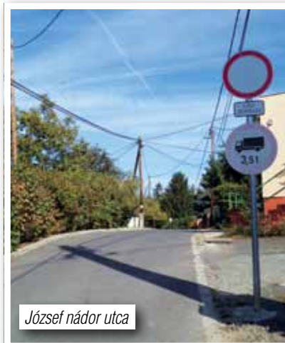
József nádor utca

• Közterületeink gyommentesítése folyamatos volt, a parlagfű-mentesítés úgyszintén.