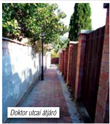
Doktor utcai átjáró

• A tavaszi kátyúzási munkákat 12 utcában végeztük el a szükséges járulékos munkákkal együtt. (szegélyépítés, padkarendezés, fed lapok szintre hozása stb.)