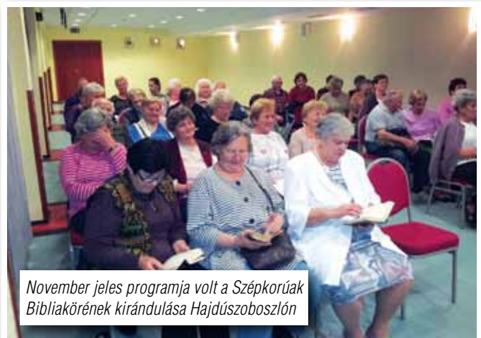
November jeles programja volt a Szépkorúak Bibliakörének kirándulása Hajdúszoboszlón

Az angyali üzenet talán ma aktuálisabb, mint valaha. Sajnos egyre durvuló világunkban mi magunk is tele vagyunk félelmekkel... Mindaz ami Párizsban történt még inkább felerősíti ezt... Féltjük a családjunkat, az életünket a munkahelyünket... s bizony igencsak be tudja mindez árnyékolni a Karácsonyunkat. Különösen, ha hagyjuk eluralkodni ezeket az érzéseket és félelem lelkét a szívünkben. Ezzel szemben szólal meg Isten biztató Igéje: „Ne féljeteK!” S nekünk Jézus Krisztusban hívő embereknek valóban nincs is mitől, ha az Élő Isten Kezébe tettük az életünket, s megkaptuk az Ő Szentlelkét! Isten válasza a félelmeinkre: Jézus! S, ahhoz, hogy biztonságban érezd magad semmi más nem kell tenned, csak be kell engedned Isten Szentlelkét és Igéjét a szívedbe, s ha rábírod magadat a Szeretetére, akkor nemcsak megszabadulsz a félelmeidtől, de igazi Karácsonyod is lesz! Az Úr félelem helyett örömet akar adni neked, engedj hát Neki! Ámen.