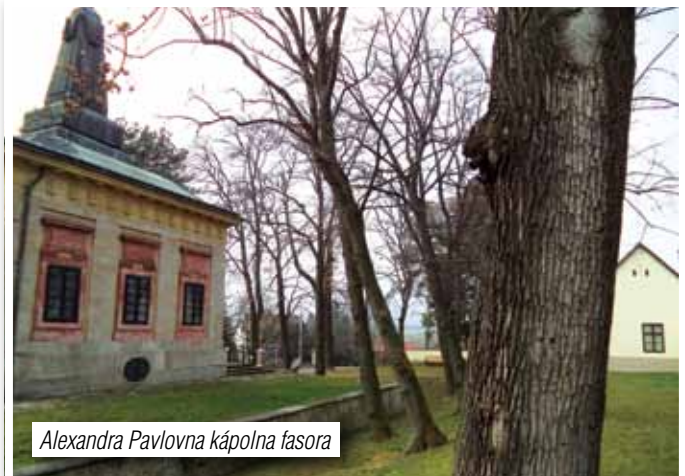
Alexandra Pavlovna kápolna fasora