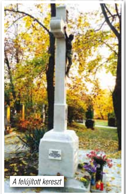
A felújított kereszt