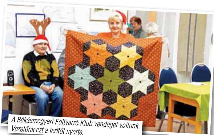
A Békásmegyeri Foltvarró Klub vendégei voltunk. Vezetőnk ezt a terítőt nyerte.