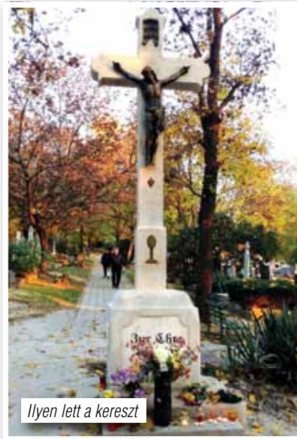
Ilyen lett a kereszt