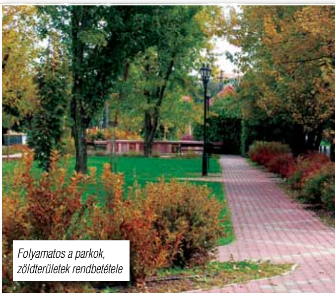
Folyamatos a parkok, zöldterületek rendbetétele