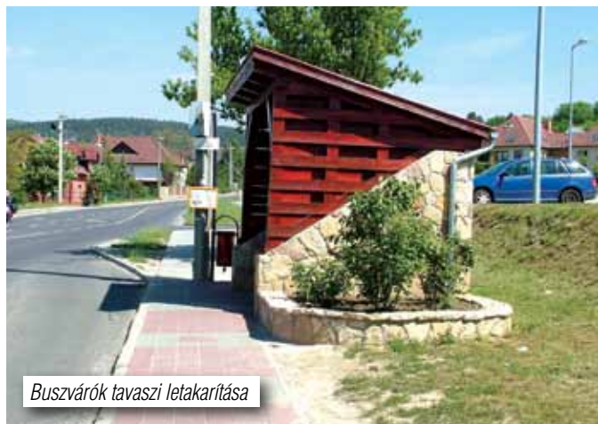
Buszvárók tavaszi letakarítása