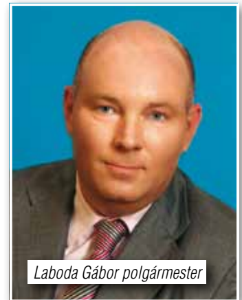
Laboda Gábor polgármester

A KEOP-5.7.0/15-2015-0243 Üröm Község Önkormányzat középületeinek energetikai korszerűsítése című projekt az Európai Unió 100%-ban vissza nem térítendő támogatásából az Új Széchenyi Terv keretében valósult meg.