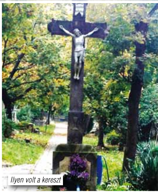
Ilyen volt a kereszt

Értesítjük az újság olvasóit, hogy elkészült a honlapunk, melyet az alábbi címen érhetnek el: www.nemet-nemzetiseg-urom.hu 2016.01.30-án 19 órai kezdettel a Német Nemzetiségi Önkormányzat Üröm, Sváb bált rendez a Művelődési Házban. A zenét a pilisvörösvári Ungarndeutsche Jungs szolgáltatja. A részleteket honlapunkon megtekinthetik az érdeklődők. Minden kedves olvasónak Áldott, békés karácsonyi ünnepeket, örömeiben gazdag Boldog Új évet kívánunk! FRÖHLICHE WEIHNACHTEN UND EIN GLÜCKLICHES NEUES JAHR!