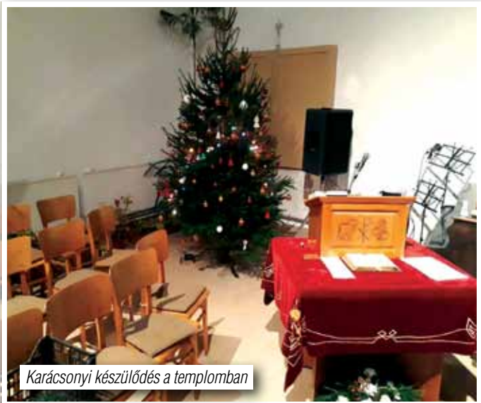
Karácsonyi készülődés a templomban

Mind az ószövetségi írás, mind az apostoli tanítás azt mondja, hogy a hívő ember küldetése csillaggá válni, ragyogni, utat mutatni a sötét éjszakában, tájékozódási pontnak lenni a többi ember számára, hogy az élet sok