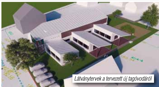
Látványtervek a tervezett új tagóvodáról

• 2 db új gépkocsit vásárolt önkormányzatunk a rendőrség részére. A tárgyi eszközök biztosításával tovább kívántuk erősíteni a helyi közbiztonságot, illetve az ebben részt vevők munkáját. A gépjárművek legyártása megtörtént, üzembe helyezésükre 2019. januárjában kerülhet sor.