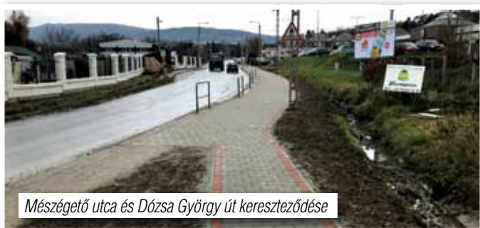
Mészégető utca és Dózsa György út kereszteződése

beruházás során megsemmisüljön. Így került sor új nyomvonal kijelölésére a Gábor Áron sétány 010/94 hrsz-ú út a patak mentén a Cseresznyés út (kishídig), ennek hossza 1505 fm. A tervezett beruházás ebben az évben biztosan nem valósul meg, mivel eddig kétszer volt közbeszerzés kiírva. Az első eljárásban nem volt pályázó, mivel a visszajelzések szerint túl alacsonynak ítélték a pályázati felhívásban megjelölt nettó beruházási költséget. A másodszori kiírásunkra egy pályázat érkezett, mely pályázat magasabb összeget jelölt ajánlatában, mint amekkorát a képviselő-testület határozatában megszabott. Így ez a pályázat is eredménytelen volt. A képviselő-testület döntött a harmadik kiírásról, amely jelenleg folyamatban van, nem meghívásos, hanem nyílt eljárás lesz. Bízunk abban, hogy eredménnyel zárul majd ez a közbeszerzési kiírás, illetve pályázat. A beruházás költsége rendelkezésre áll, a 2019. első féléve megjelölhető a beruházás megvalósításának időpontjával.