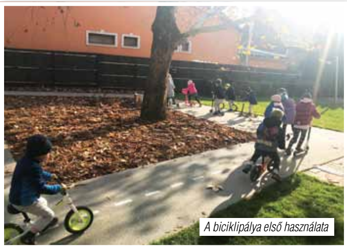
A biciklipálya első használata