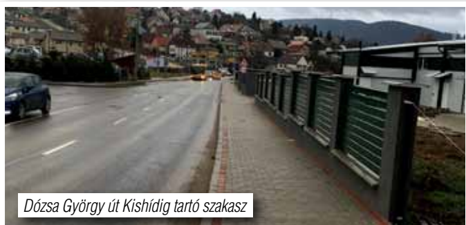
Dózsa György út Kishídig tartó szakasz