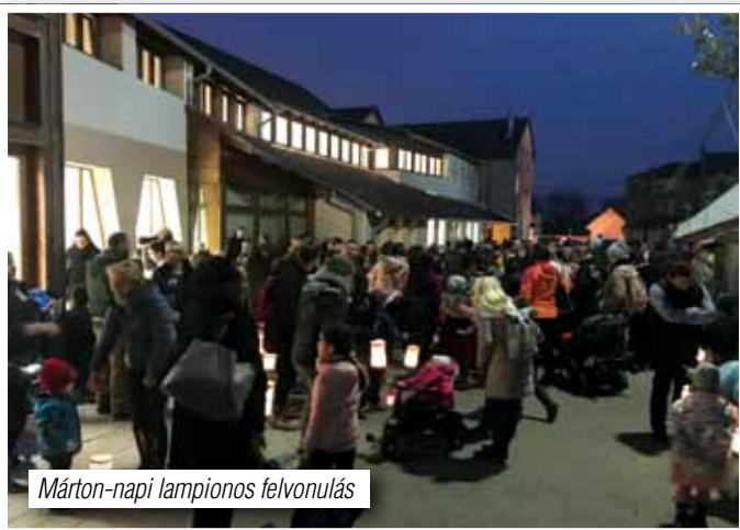
Márton-napi lampionos felvonulás

Túl vagyunk már a Télapó köszöntésén is. Idén felelevenítettük azt a régi szokást, hogy az óvodaközből várjuk a jó öreg Mikulás bácsit. Énekelünk neki, majd el is kö-