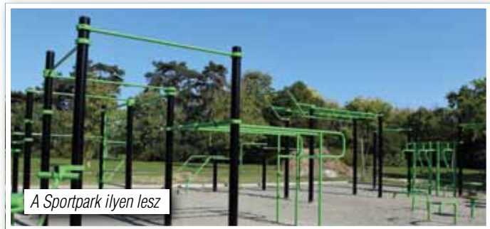
A Sportpark ilyen lesz