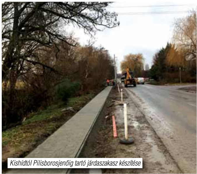
Kishídtól Pílisborosjenőig tartó járdaszakasz készítése