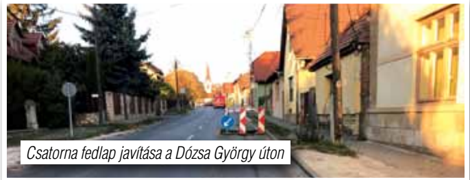
Csatorna fedlap javítása a Dózsa György úton

– Az Ürömi úton 6 db, a Dózsa György úton 1 db, összesen 7 db szintre hozását saját forrása terhére végeztette el az önkormányzat, mivel a süllyedés olyan mértékű volt, hogy az napi balesetveszélynek tette ki az ott közlekedőket.