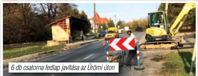
6 db csatorna fedlap javítása az Ürömi úton