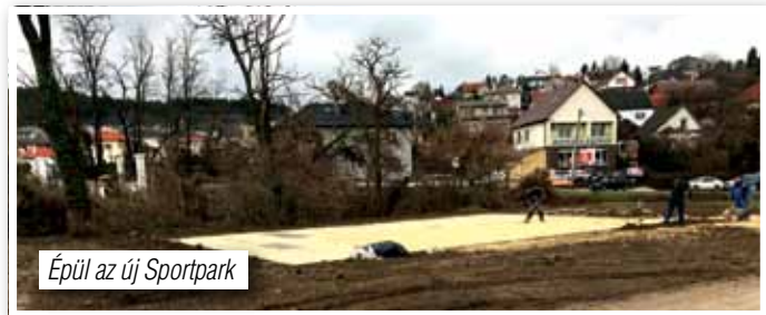
Épül az új Sportpark

A Gábor Áron sétánynál az 1333/2/3 hrsz-ú ingatlan lett kijelölve a Sportpark létesítésére. A területet az önkormányzat biztosítja, míg az egyéb járulékos munkákat szintén az önkormányzat végzeteti el. A tényleges beruházást, azaz a sporteszközök telepítését a nemzeti sportközpont koordinálja, illetve telepíti. A kivitelezési munkák jelenleg még tartanak, várhatóan ez évben a létesítmény átadásra kerül.