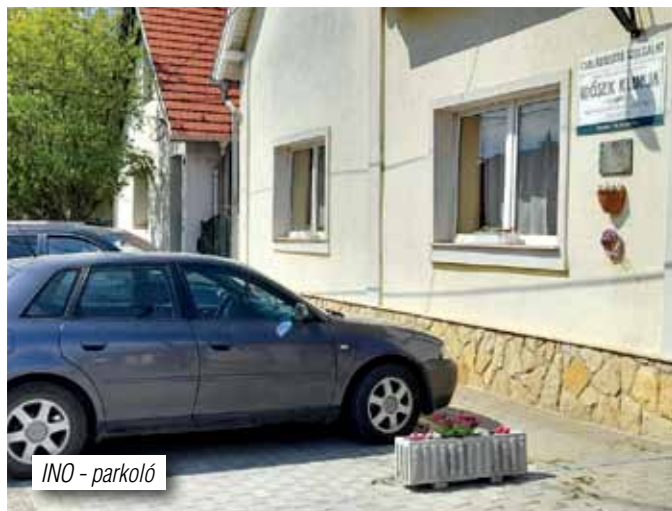
INO - parkoló