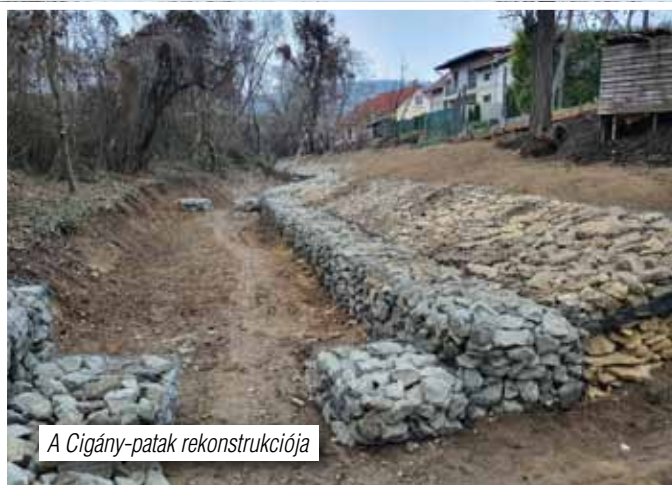
A Cigány-patak rekonstrukciója