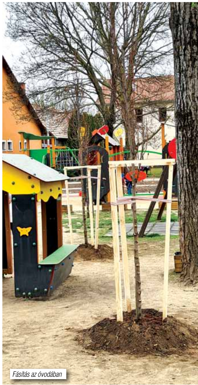
Fásítás az óvodában

nem végezte el. A csőtörés hibafeltárása és elhárítása közben jelentős kár keletkezett a növényállományban és az öntözőrendszerben, valamint a viacolor burkolatban. A Szolgáltató elismerte a károkozást és magára vállalta annak teljes kijavítását, a helyreállítást. Csak remélni tudjuk, hogy a DMRV Zrt. a helyreállítási munkálatokkal hamarosan elkészül és újra használható lesz a park ezen része is.