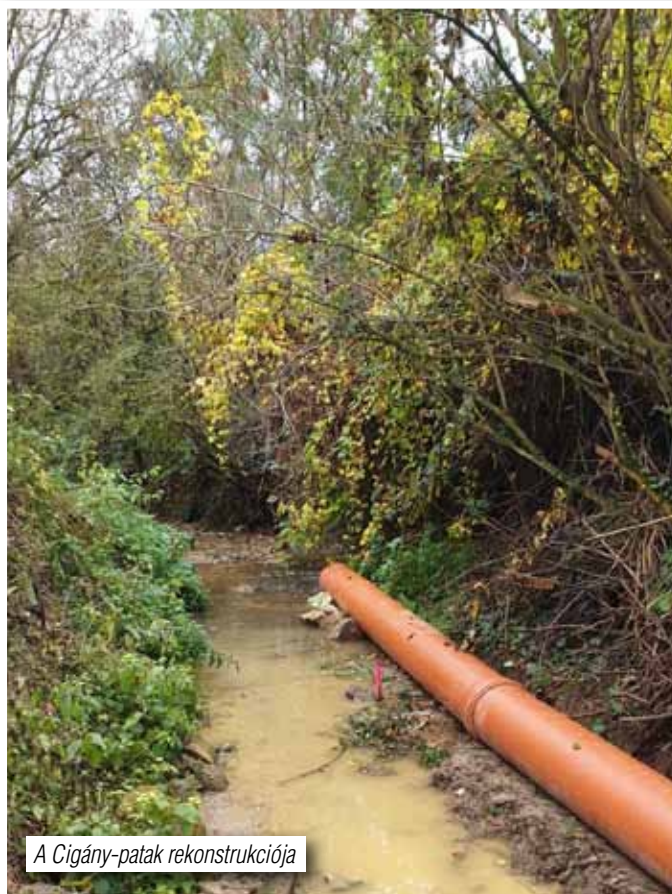
A Cigány-patak rekonstrukciója