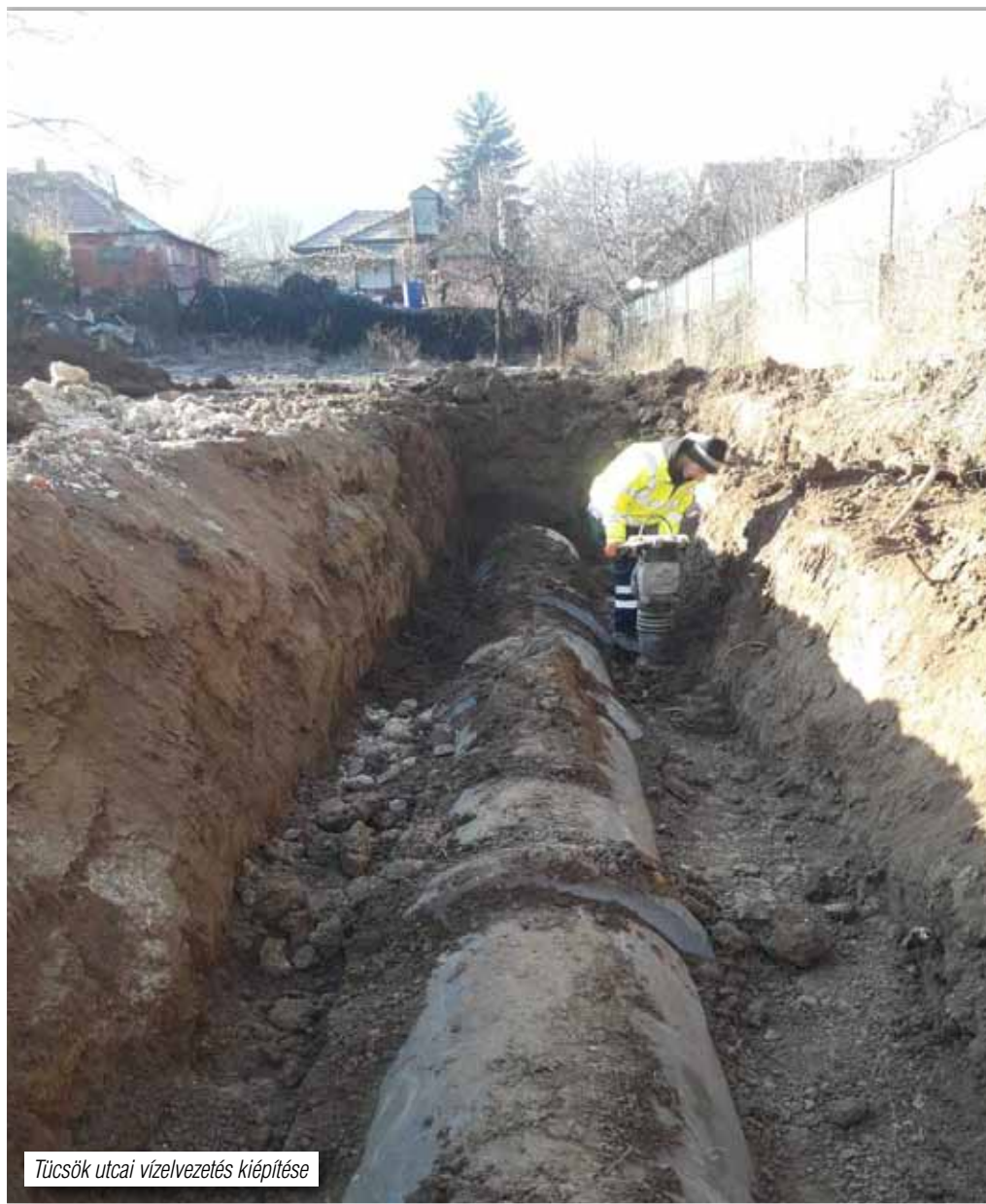
Tücsök utcai vízelvezetés kiépítése

– az ürömi Hóvirág Bölcsőde bővítése és fejlesztése, javítva ezzel a bölcsődei szolgáltatás színvonalát és hozzájárulást adva a kisgyermekes szülők munkaerőpiacra történő visszatéréséhez. A bölcsőde bővítése javítja a gyermekjóléti alapellátásokhoz való hozzáférést, valamint a szolgáltatás minőségének fejlesztése által támogatja a kisgyermeket nevelők munkavállalását – a Panoráma lakóparkban játszótér és sportpark kialakítása, amivel hozzá kívánunk járulni az ürömi lakosság elégedettségének és komfortérzetének növeléséhez, valamint nem utolsósorban a helyi közösségi összetartozás erősítéséhez. E célnak megfelelően egy olyan komplex, a szabadidő hasznos eltöltését biztosító közösségi játszótér építünk, ahol nemcsak gyermekeink, de azok szülei, kísérői is hasznos módon tölthetik majd el a szabad-