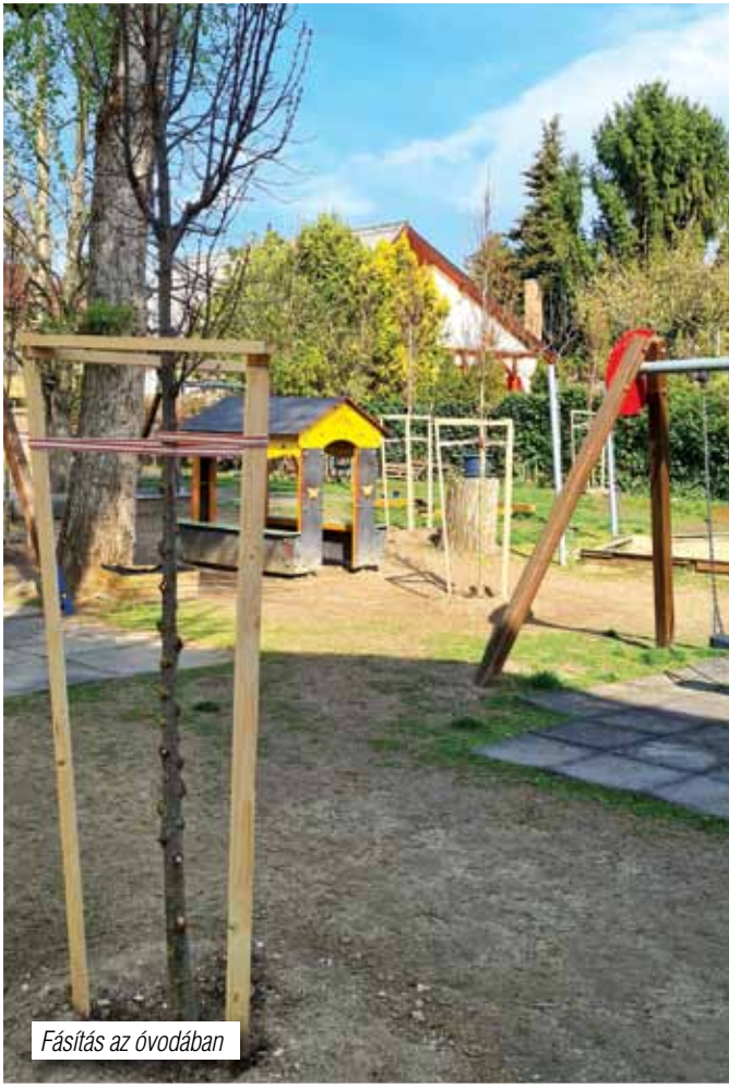
Fásítás az óvodában

mát jelent az utcákon, parkokban, játszótéren, boltok környezetében. Az önkormányzat egyre több utcai szemétyűjtőt helyez ki, azonban mégis vannak olyan lakótársaink, akik nem tudják szemetüket ezekben a gyűjtőedényekben elhelyezni. Kérünk mindenkit figyeljünk oda egy kicsit környezetünk tisztaságára és segítsük egymás munkáját azzal is, hogy nem dobáljuk szét a szemetet. Megjegyeznénk, hogy mások az otthoni kommunális hulladékkal tömik meg a köztéri kukákat. Ez azért is érthetetlen, hiszen minden ürömi ingatlan tulajdonosnak rendelkeznie kell hulladékelszállítási szerződéssel és a Depónia Kft. hetente szállítja el a kommunális hulladékot. A település külső részein egyre ritkábbak az illegális szemétkerakások, ez köszönhető talán a kihelyezett kameráknak, a gyors és hatékony felderítésnek, illetve a tetten ért elkövetők szankcionálásának.