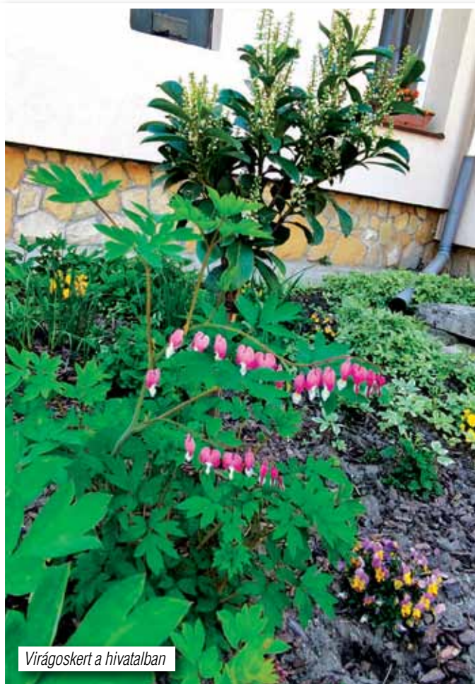
Virágoskert a hivatalban

meghirdetve a lakosság részére fásítási program. Ennek keretében 72 db gyümölcsfából / szilva, körte, kajszai- és őszibarack, alma, cse-resznye/ választhattak az ürömi jelentkezők. A nagy érdeklődésre tekintettel és a pozitív visszajelzéseket figyelembe véve ősszel megszeretnénk ismételni ezt a programot, akkor már díszfákkal kiegészítve a kínálatot. A lakosság a jelentkezési időpontról, a választható fajfajtaokról a későbbiekben lesz a szokásos módon (honlap, facebook, újság) tájékoztatva. Ezúton is szeretnénk megköszönni a gyümölcsfákat az erdélyi Felenyedi Református Egyházközségnek és országgyűlési képviselőknak a közvetítést.