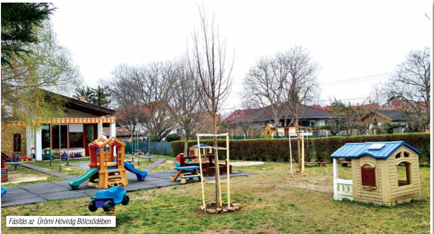
Fásítás az Ürömi Hóvirág Bölcsődében