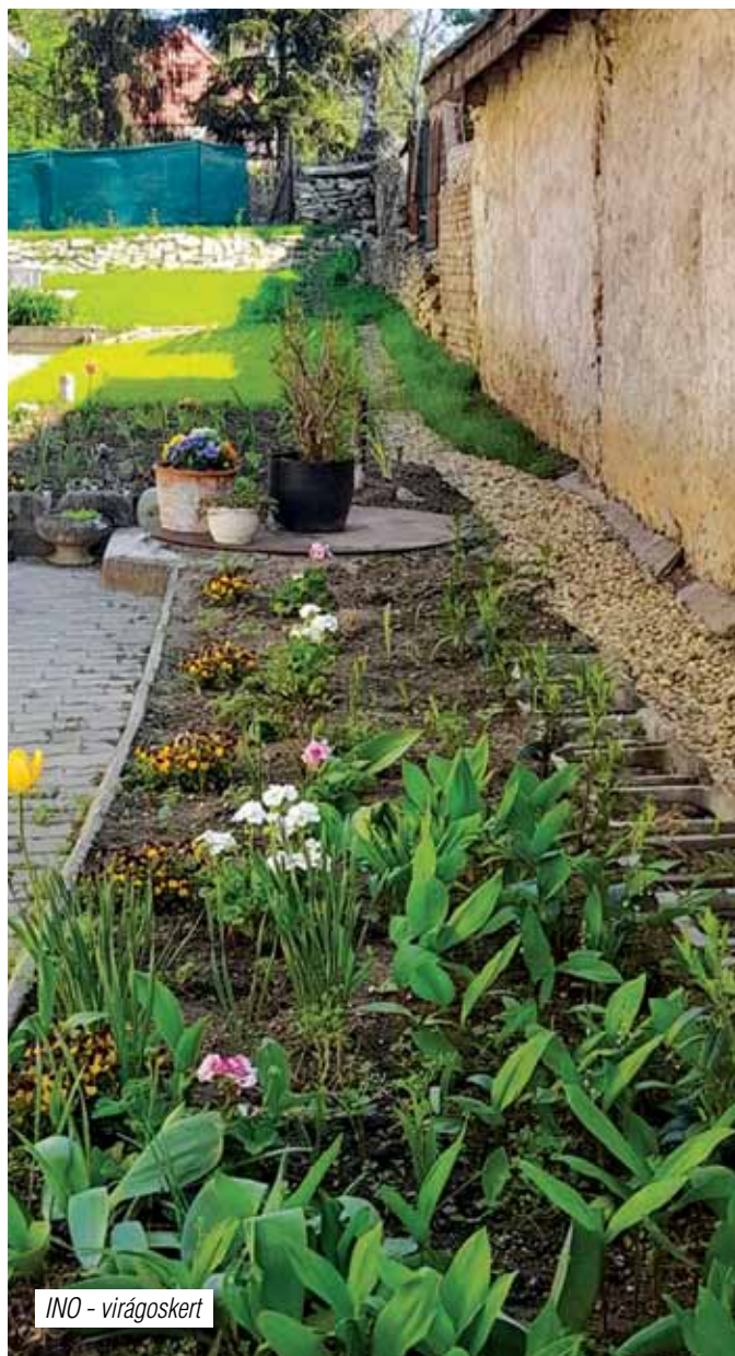
INO - virágkert