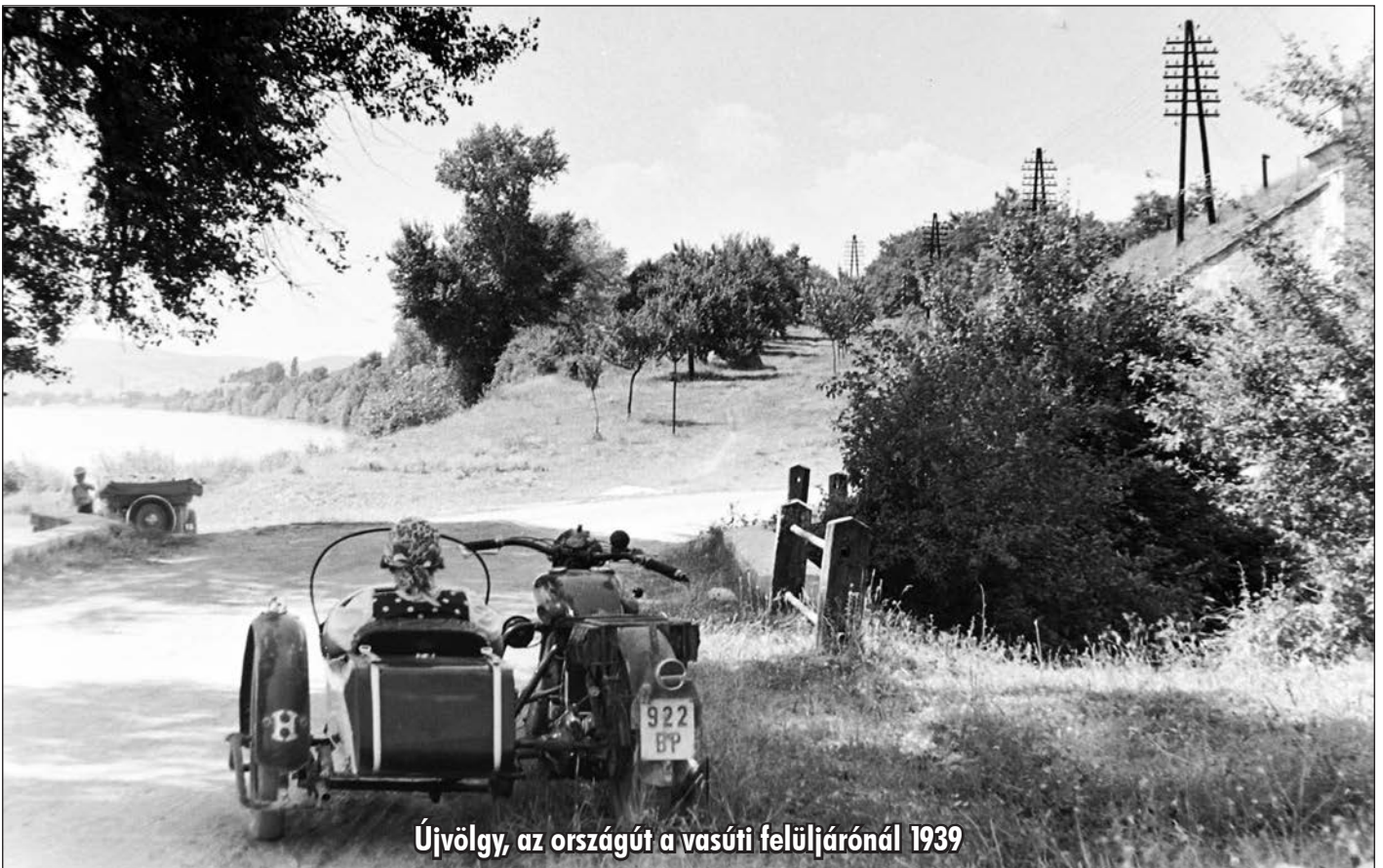
Újvölgy, az országút a vasúti felüljárónál 1939