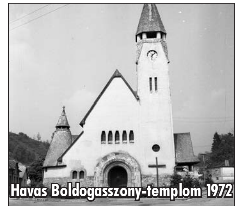
Havas Boldogasszony-templom 1972