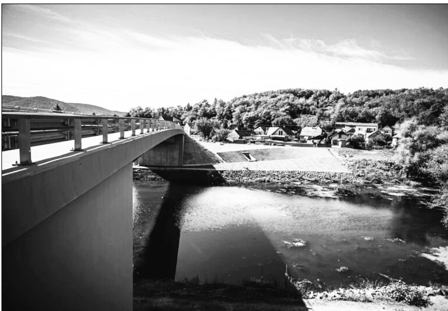
Helembai Ipoly-híd: az áprilisi átadás is csúszhat