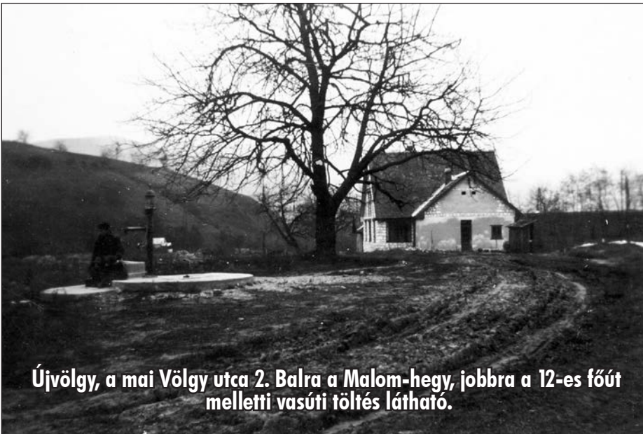
Újvölgy, a mai Völgy utca 2. Balra a Malom-hegy, jobbra a 12-es főút melletti vasúti töltés látható.