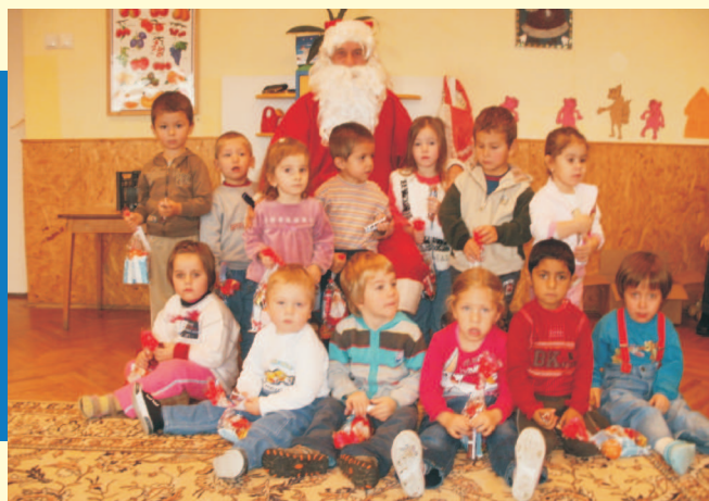
Télapó az óvodában