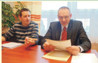
Tárgyalás az adósságkonszolidációról

2012. október 27-én került sor az „Önkormányzatok az adósság csapdájában” című rendezvényre Budapesten. Az akkor tett miniszterelnöki bejelentés értelmében az 5000 fő alatti települések adósságát teljesen, az