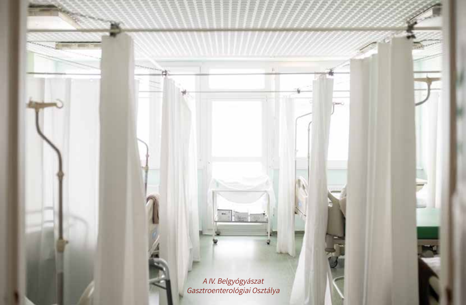
A IV. Belgyógyászat Gasztroenterológiai Osztálya