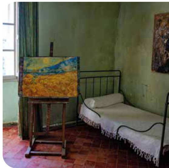
Van Gogh egykori szobájának rekonstrukciója (Saint-Paul de Mausole kolostor, Provence, Franciaország)