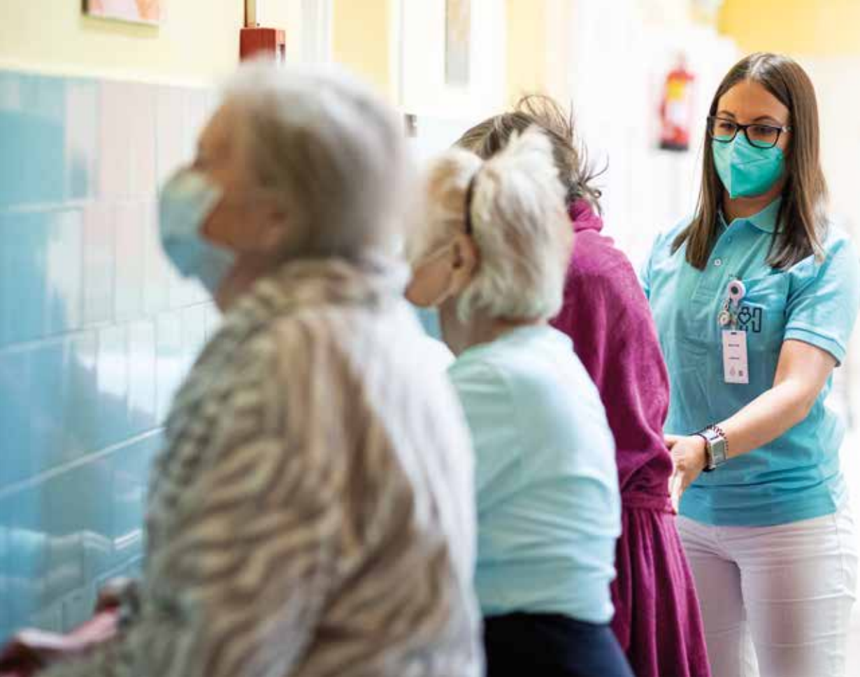
Egy kis átmozgatás