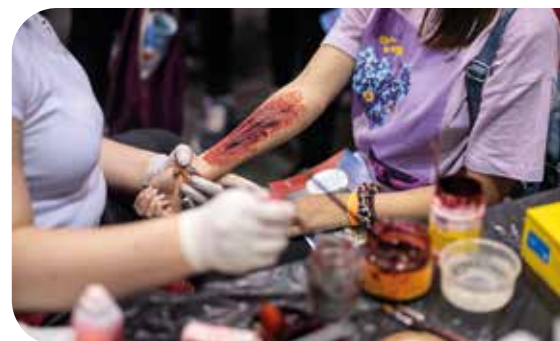
Szerencsére ez csak a látszat...

A kiállításon való részvétel egészen biztosan pozitív hatással volt a látogatókra, a standtól távozók tudással, élményekkel és néhányan még frissen szerzett (mű)sebekkel is gazdagodtak.