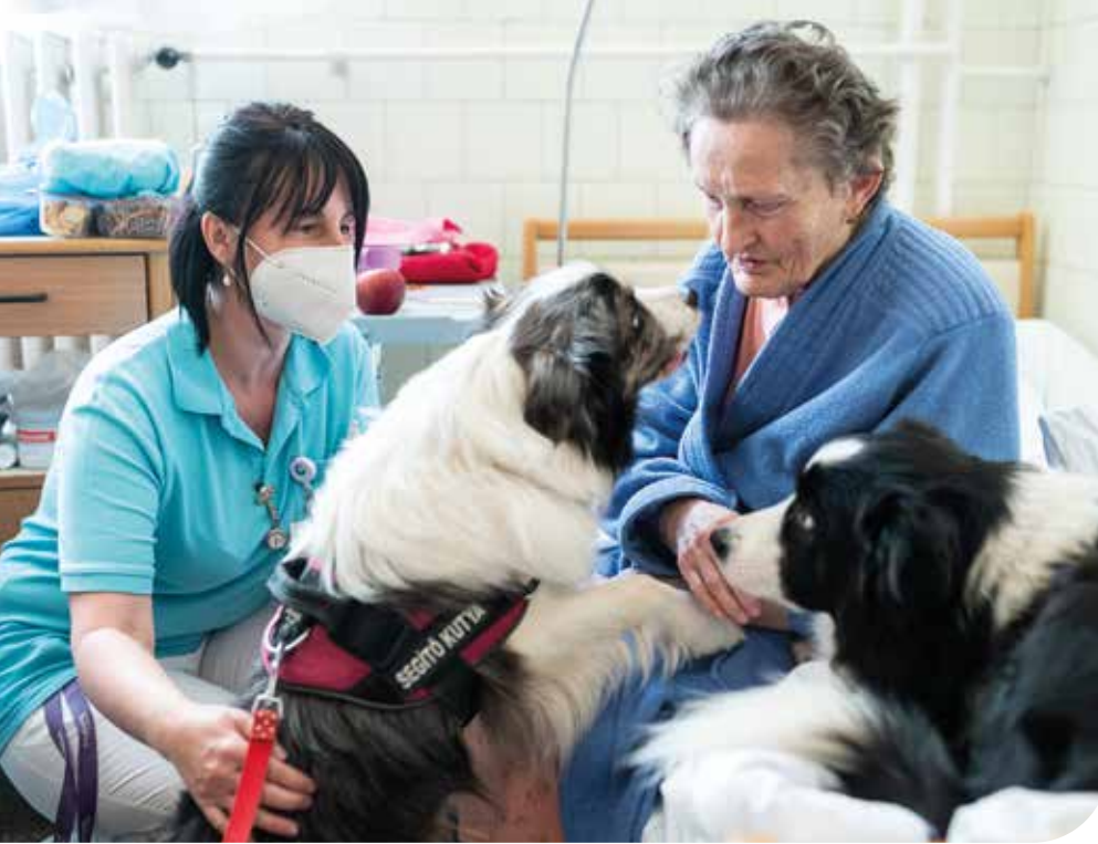
Terápiás kutyák a hospice-osztályon

családtag lenne számára is a beteg: a családtagokhoz is úgy fordulunk, hogy segítjük és támogatjuk őket.”