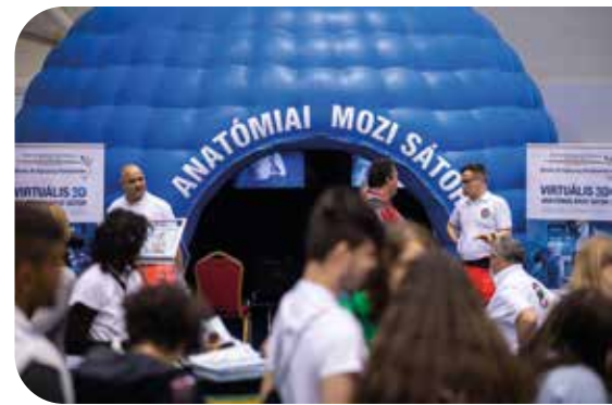
Az anatómiai 3D sátor – kívülről

A területen négy állomás volt, ahol el lehetett kalandozni az egészségügy világába. Az egyik helyszín az anatómiai 3D sátor, ahol az emberi test működésével kapcsolatban lehetett filmeket nézni. A másik izgalmas helyszín, ami már kicsit aktívabb