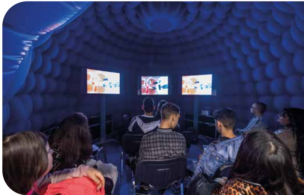
Az anatómiai 3D sátor – belülről

A Magyar Egészségügyi Szakdolgozói Kamara gondosan kitalált standja egyértelműen elnyerte a fiatalok tet-