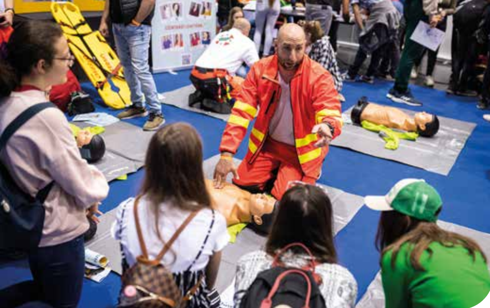
A gyerekek gyakorolják az újraélesztést

részvételt kívánt, ahol az újraélesztést lehetett gyakorolni mentősök segítségével.