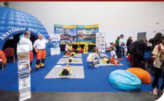
A MESZK standja a Szakma Sztár Fesztiválon

szését. Egész nap kigyózó sor állt az interaktív tér előtt. Talán azért, mert tényleg igazán interaktív volt, játszva tanított. A sorban kisebbek, nagyobbak és felnőttek várahoztak.