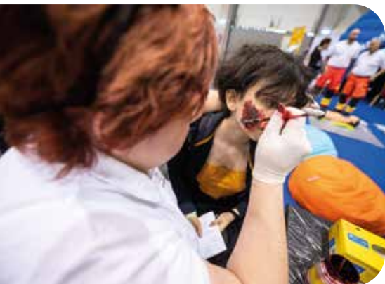
Készülnek az ijesztő sérülések

A harmadik helyszínen a szimulációs állomás volt, ami a gyerekek egyik kedvenc programja volt. A részeg szemüveg segítségével megtapasztal-